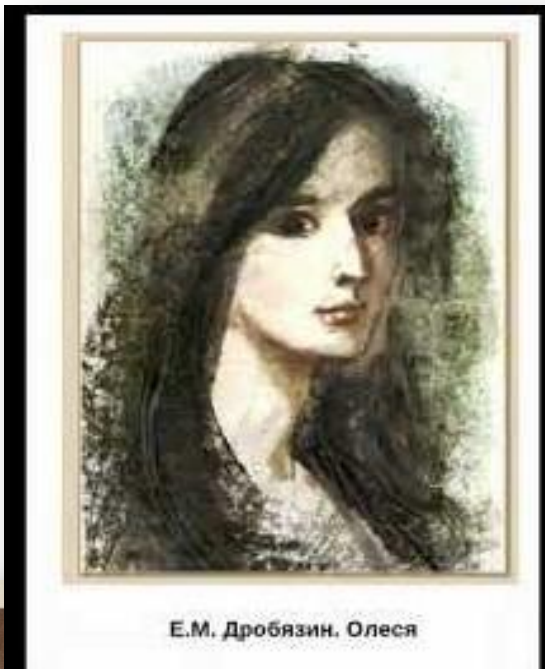
Е.М. Дробязин. Олеся

□ В портрете героини автор подчеркивает естественную красоту девушки, указывает на черты, позволяющие судить о ее характере.