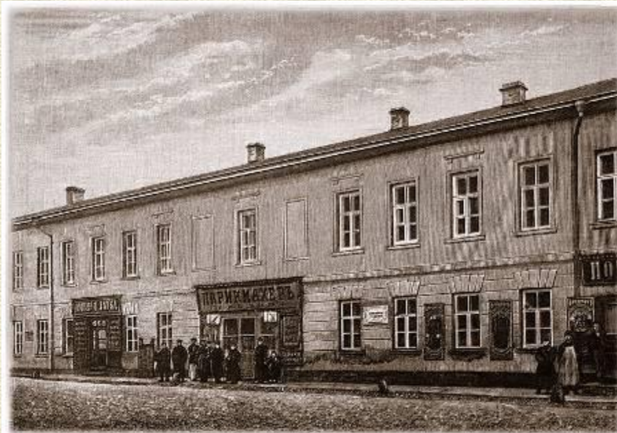
Дом, в котором родился А.С. Пушкин

Будущего поэта крестили 8 июня в честь святителя Александра, патриарха Константинопольского, в церкви Богоявления (ныне это патриарший собор).