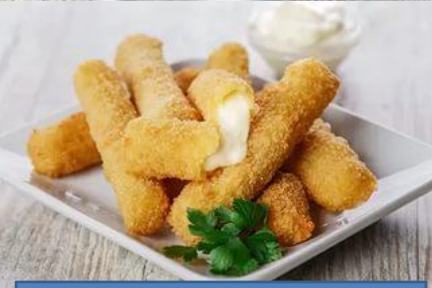
Сыр жареный в кляре