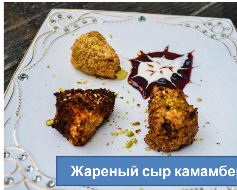
Жареный сыр камамбер