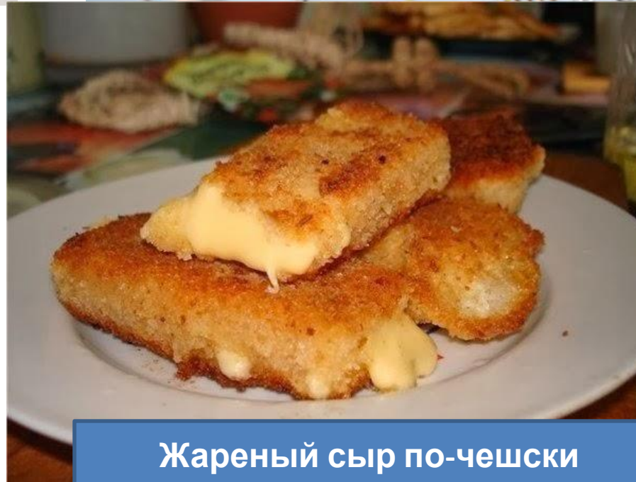
Жареный сыр по-чешски