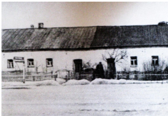
Фото 1970 г.