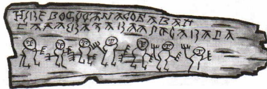
Берестяная грамота из Новгорода