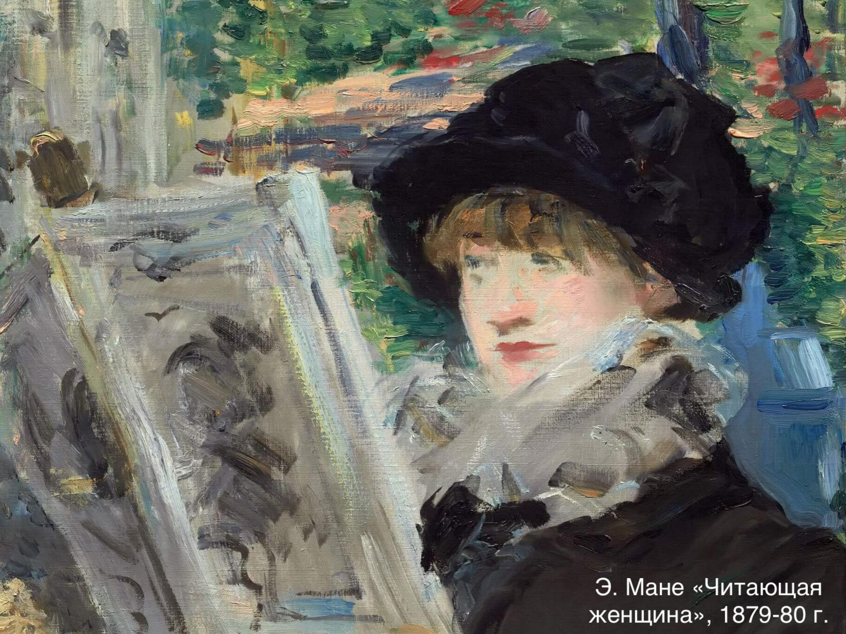
Э. Мане «Читающая женщина», 1879-80 г.