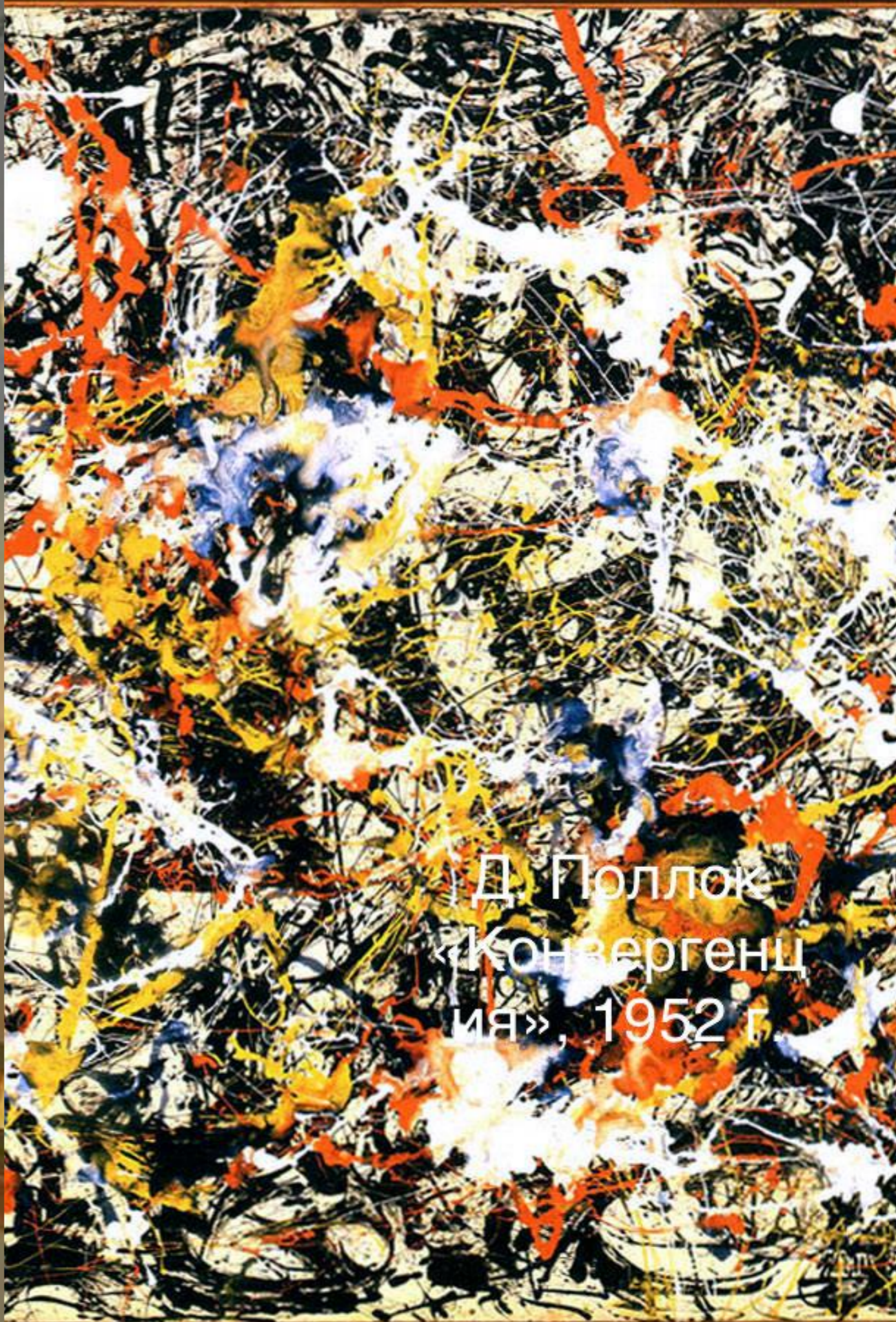
Д. Поллок «Конвергенция», 1952 г.