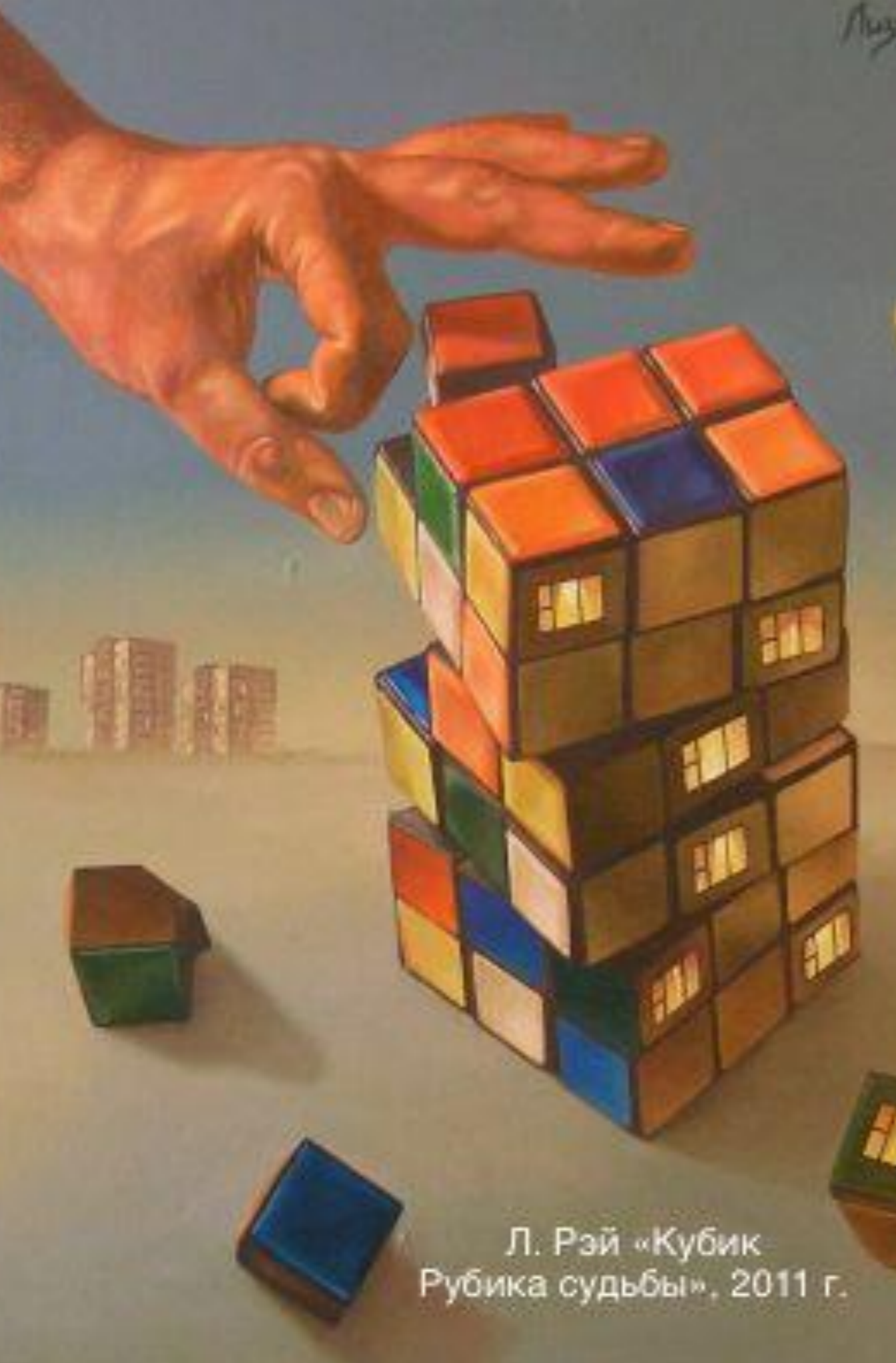
Л. Рэй «Кубик Рубика судьбы», 2011 г.