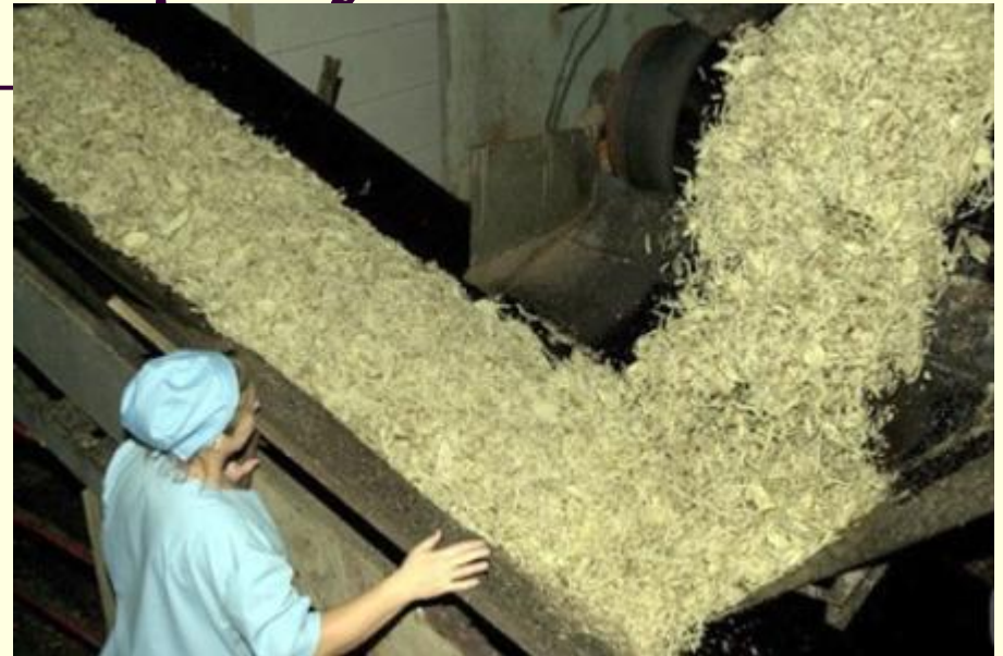
Переработка сах. свеклы

Почти вся продукция сельского хозяйства перерабатывается на месте. В ряде случаев мощности предприятий пищевой промышленности так велики, что позволяют использовать не только местное сырье (например, сахарная промышленность перерабатывает импортный сахар-сырец).