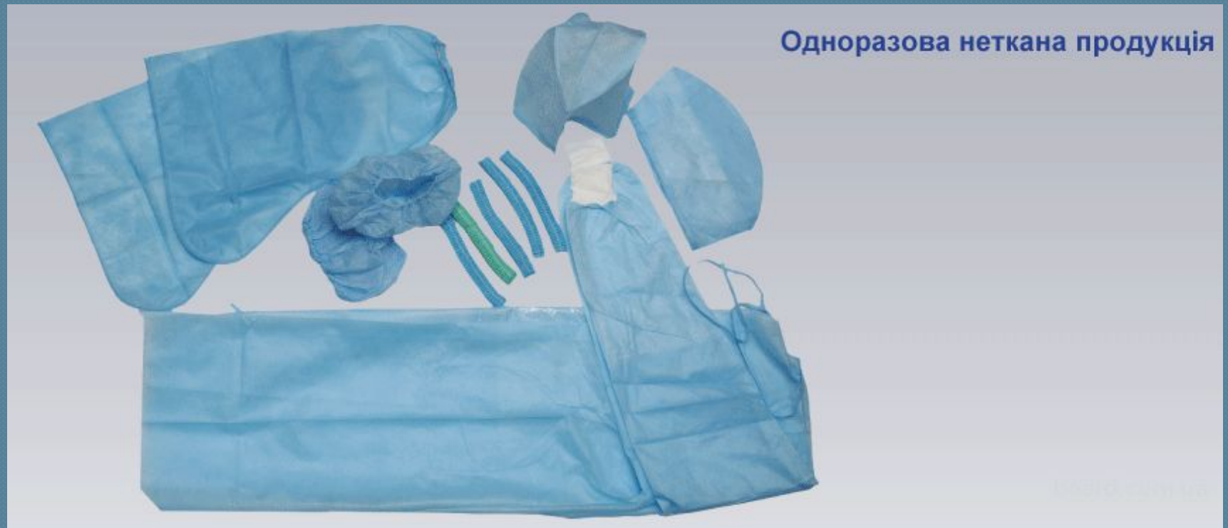
Одноразова неткана продукція