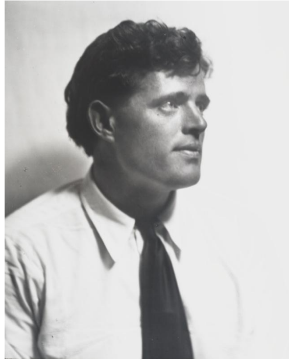
Фото и описание Джека Лондона