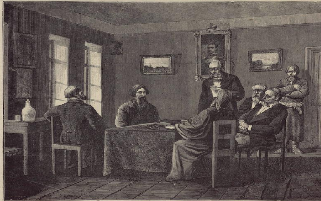
Картина земства. Земская Уездная Управа.