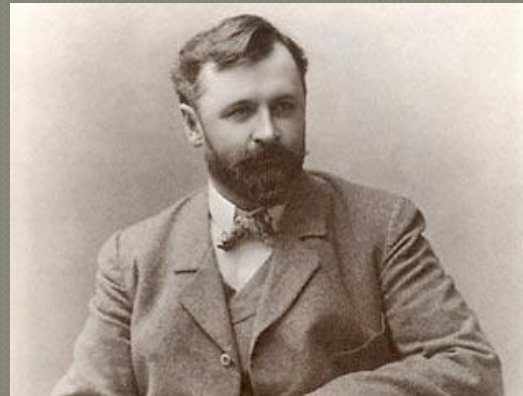
○ К. Коровин.