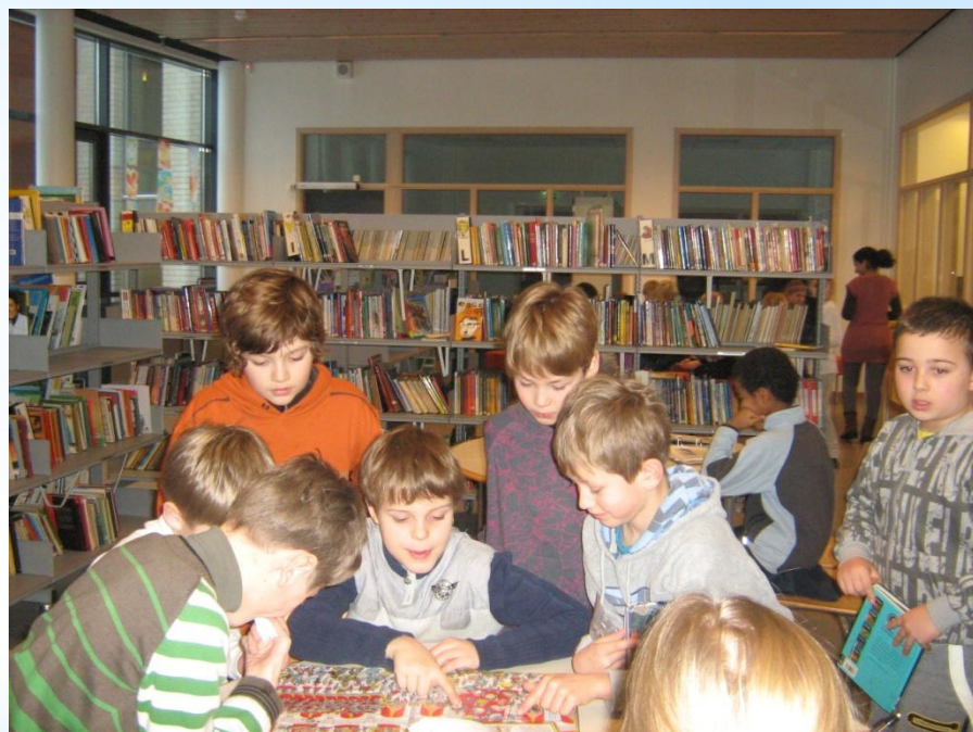
Нашли общий язык.