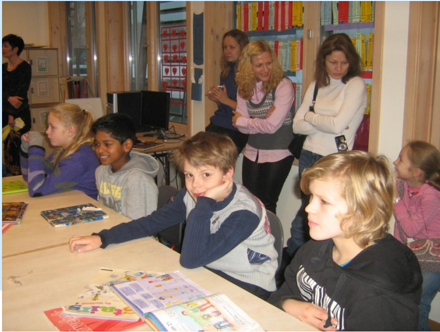
Урок английского языка.