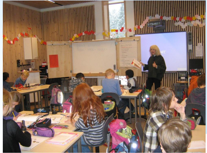
Урок норвежского языка.