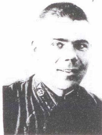
Помощник командира взвода, временно старший писарь финансовой службы части, январь 1941 г.