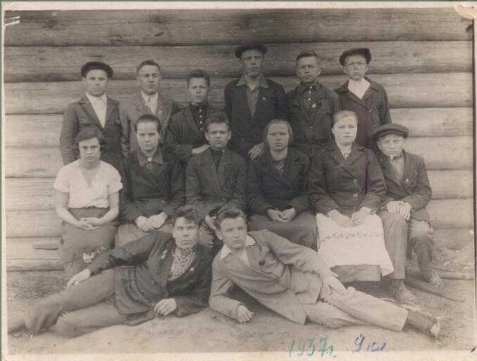
Первый выпуск Тарногской средней школы (фото 1937 года)