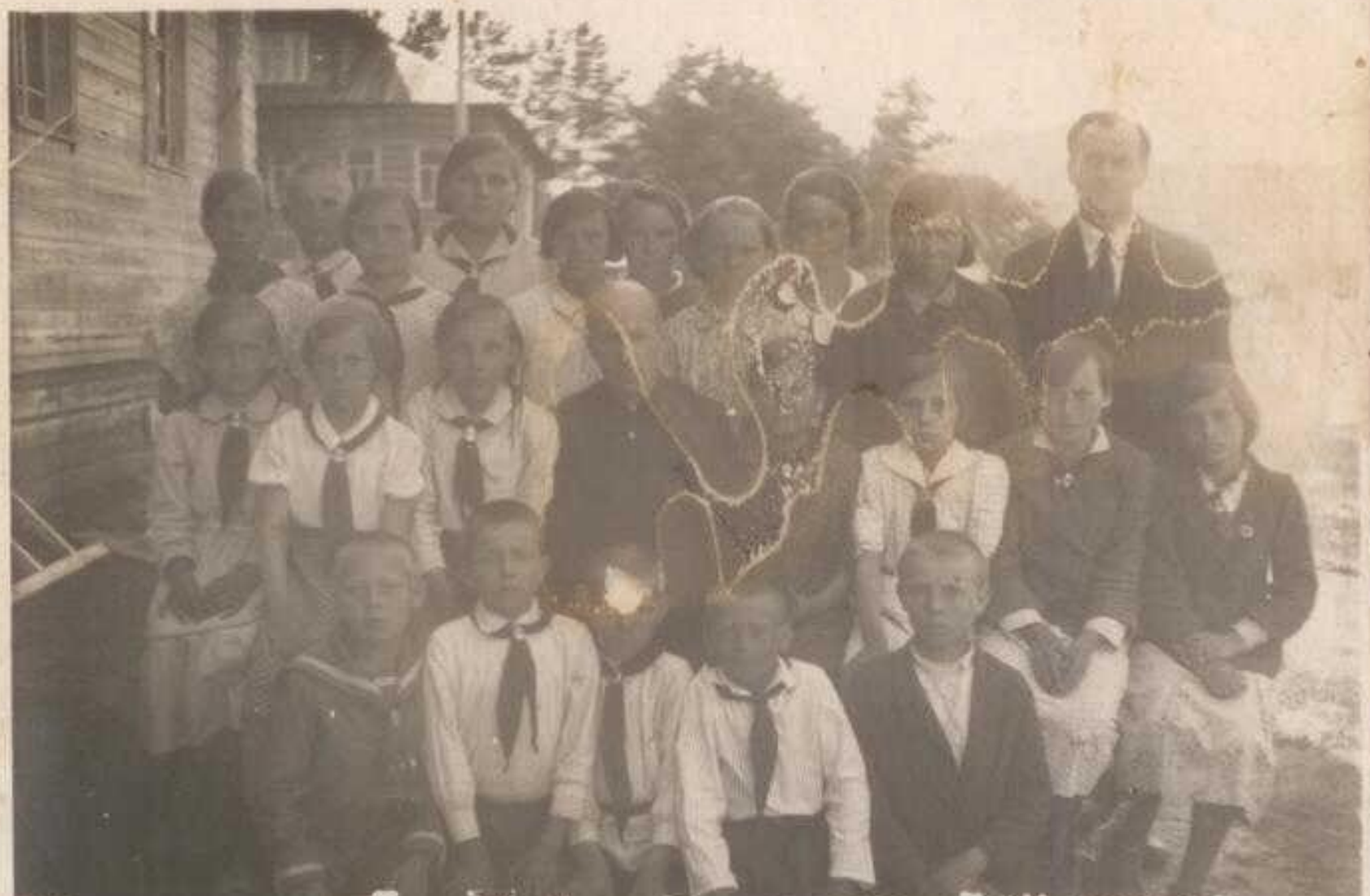
Ударники учебны IV-V кл. Тарногской С.Ш 1938-39 уч.г.