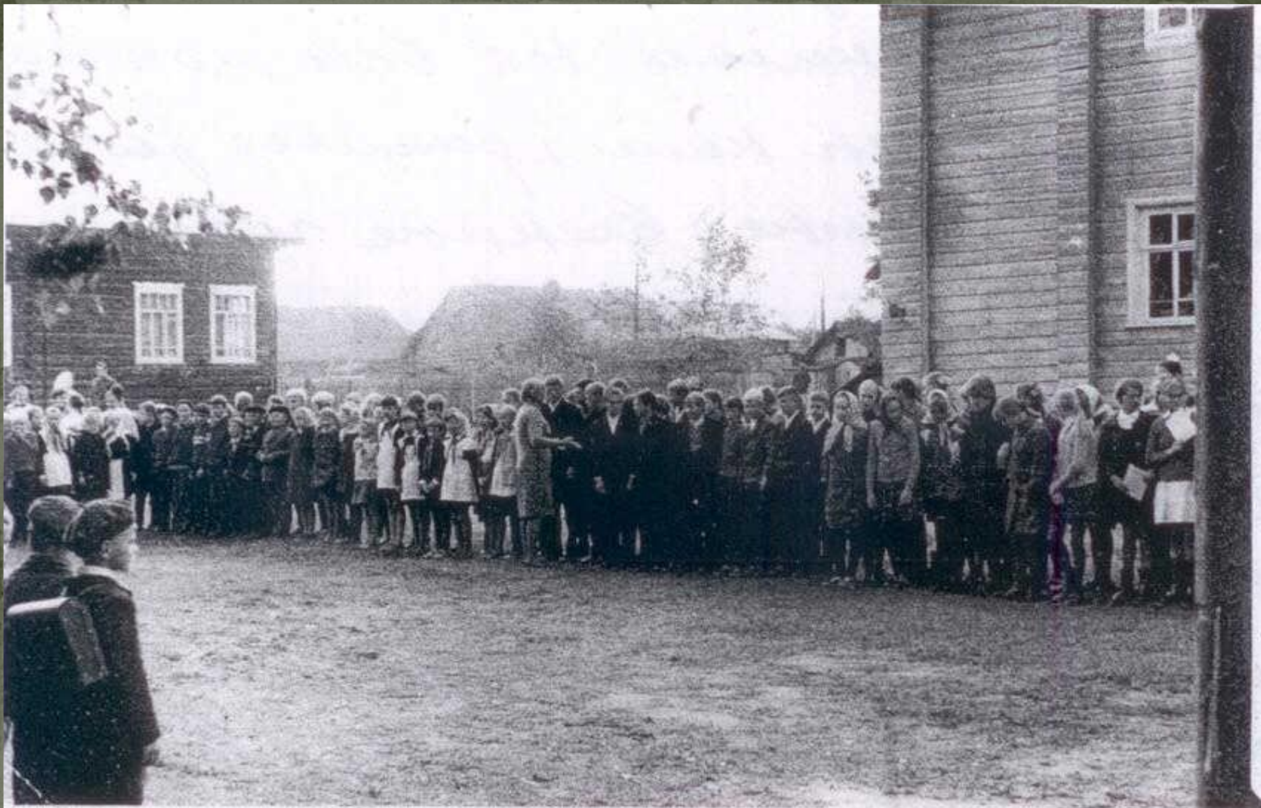
Школьная линейка (1960-е годы)