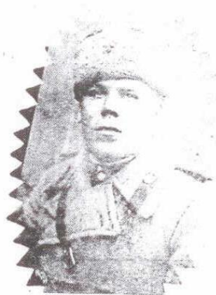
Заместитель командира ар- тиллерийского дивизиона. Белорусский фронт, февраль 1944 г.