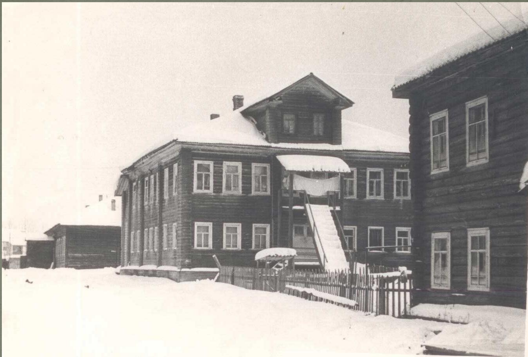
Школьный городок (1960-е годы)