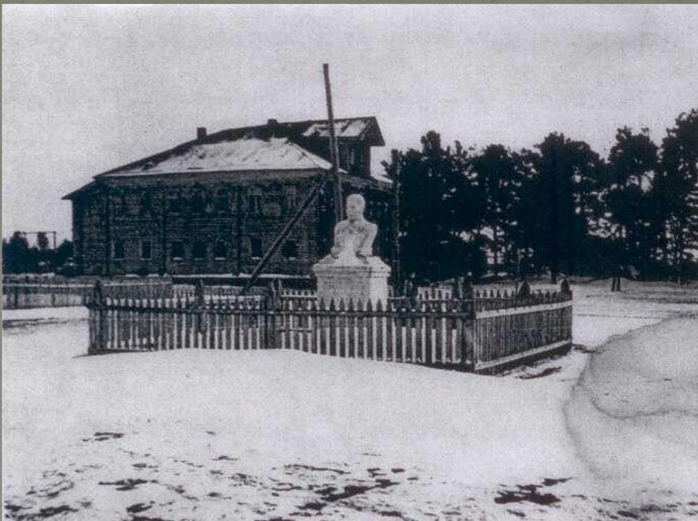
Здание Тарногской средней школы в 1930-е годы