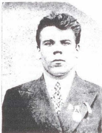
Учитель начальных классов, учитель математики в 6-х—7-х классах, 1938 год