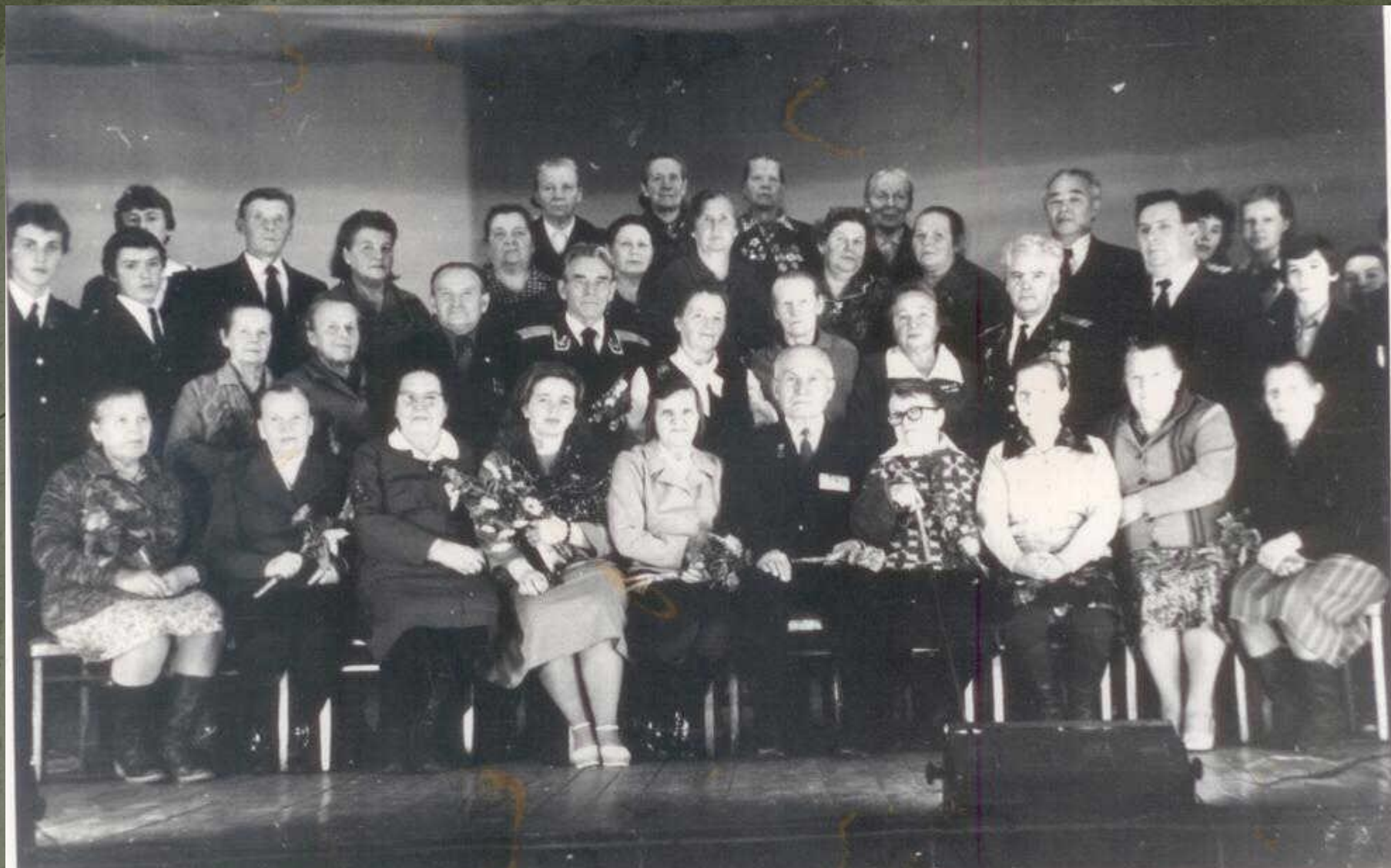
Вечер выпускников довоенных и военных лет (октябрь 1986 года)