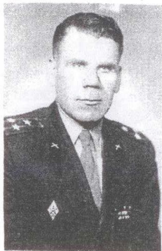
Начальник политического отдела Радиотехнического училища войск ПВО страны. Ленинградский округ, 1959 г.