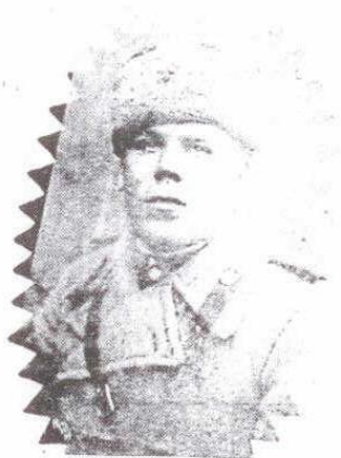
Заместитель командира ар- тиллерийского дивизиона. Белорусский фронт, февраль 1944 г.