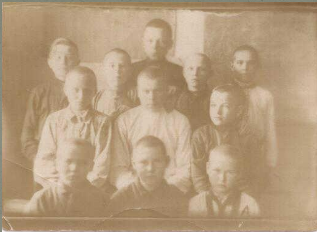
Будущие выпускники в 5 классе