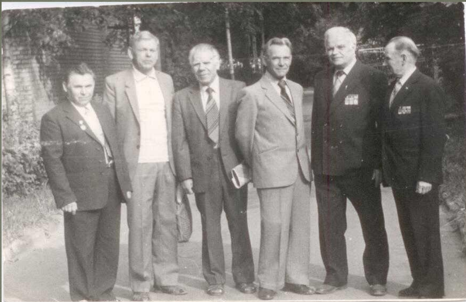
Встреча одноклассников (1984 год)