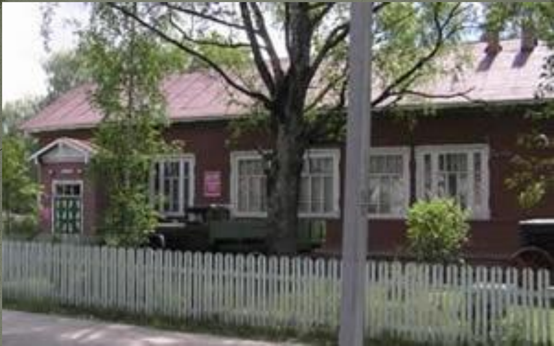
Одно из зданий Тарногской средней школы (построено в 1927 году, к 10-летию Советской власти).