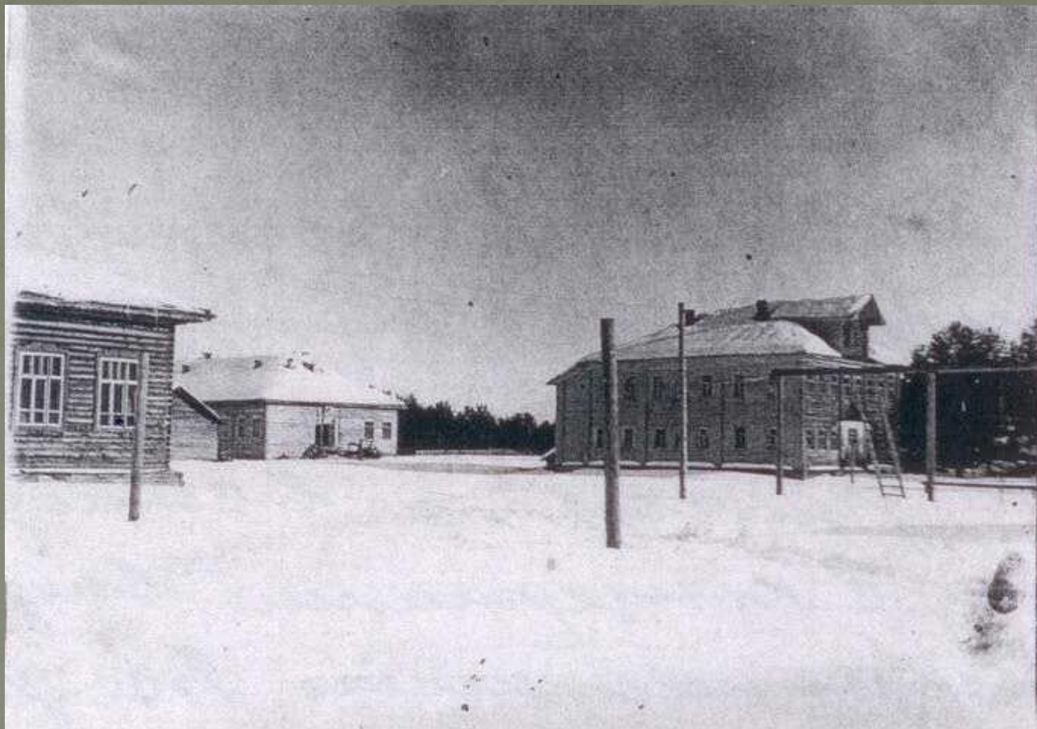
Школьный двор (послевоенные годы)