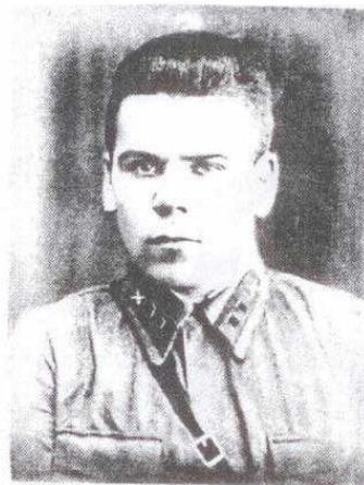
Младший политрук — за- меститель командира артил- лерийской батареи по полит- части. Брянский фронт, 1942 г.