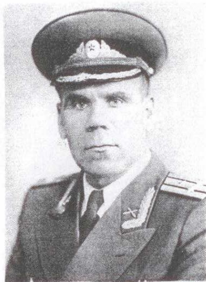
Учеба на Высших Академических курсах старшего Политсостава Армии, 1958 г.