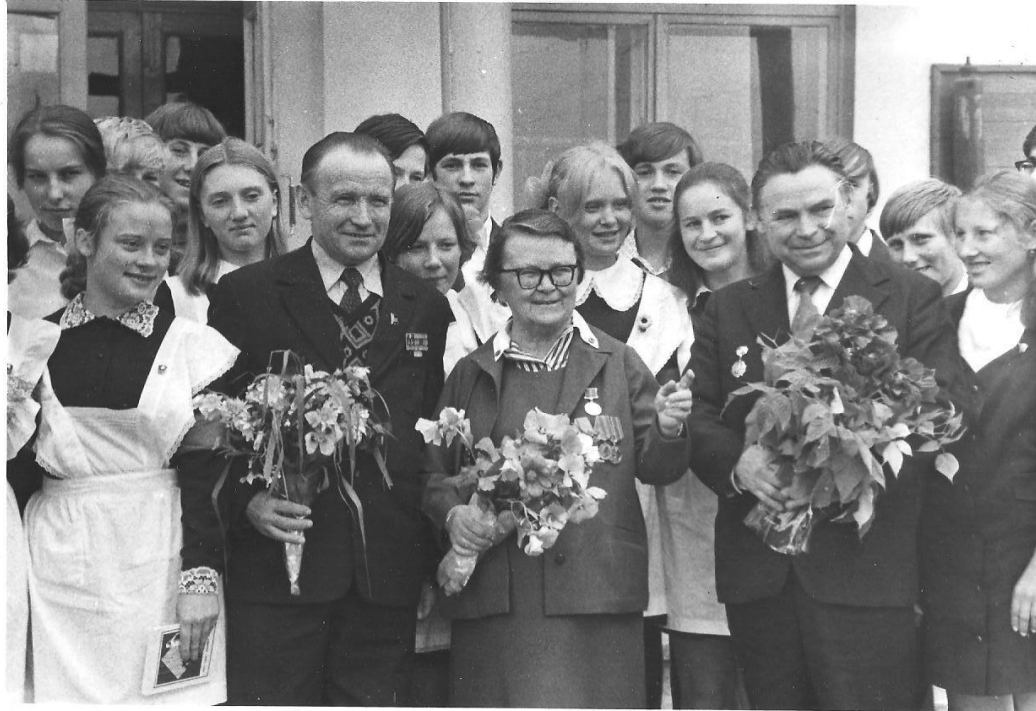
Встреча первого и 41-го выпусков