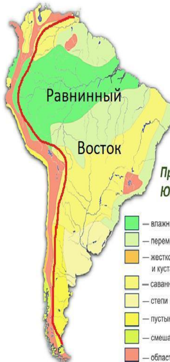
Природные зоны Южной Америки