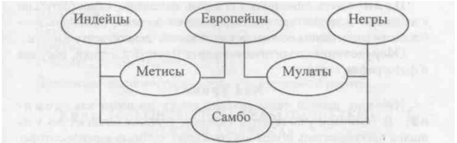
Схема в тетрадь