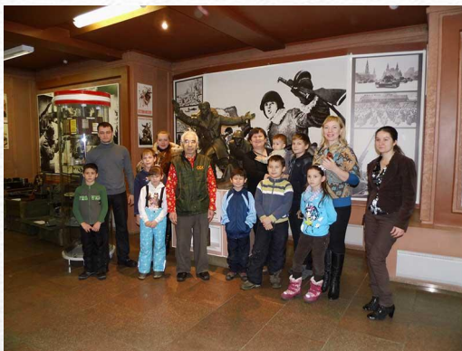
Экскурсия в «Мемориал Победы»