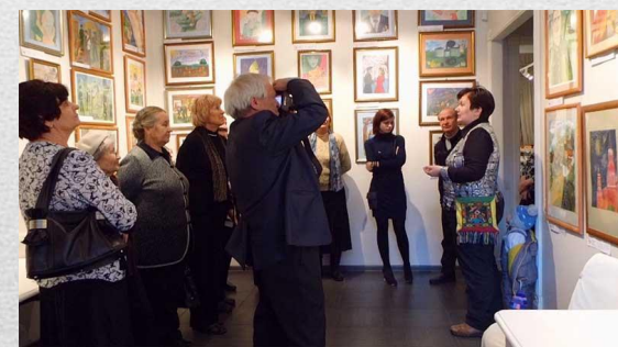
Председатели советов ветеранов Свердловского района на выставке «Живая память»