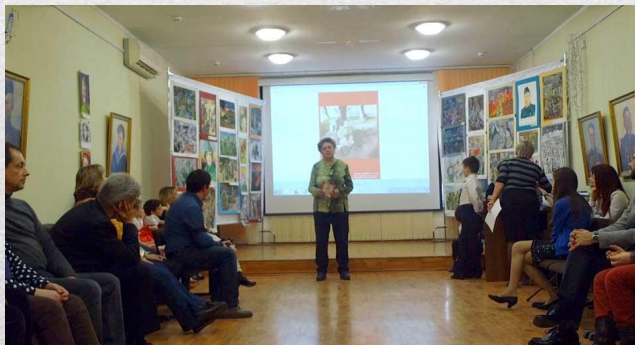
Торжественная передача музею картин