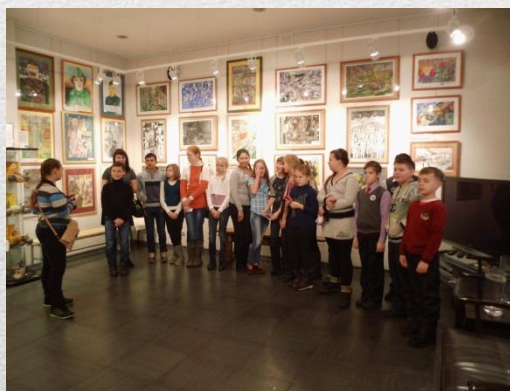
Экскурсия на выставку «Живая память» школа №93