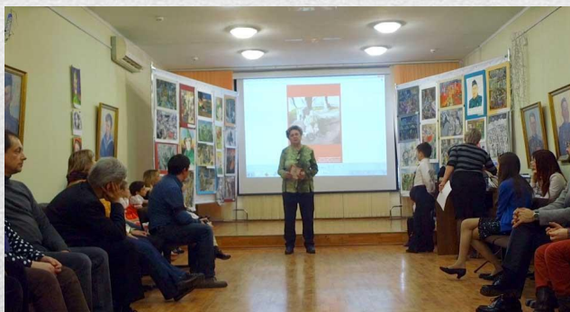
Торжественная передача музею картин