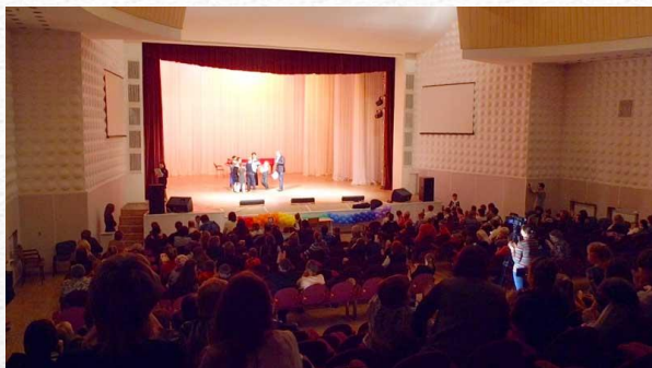
Открытие конкурса-выставки «Живая память»