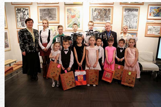
Открытие выставки финалистов