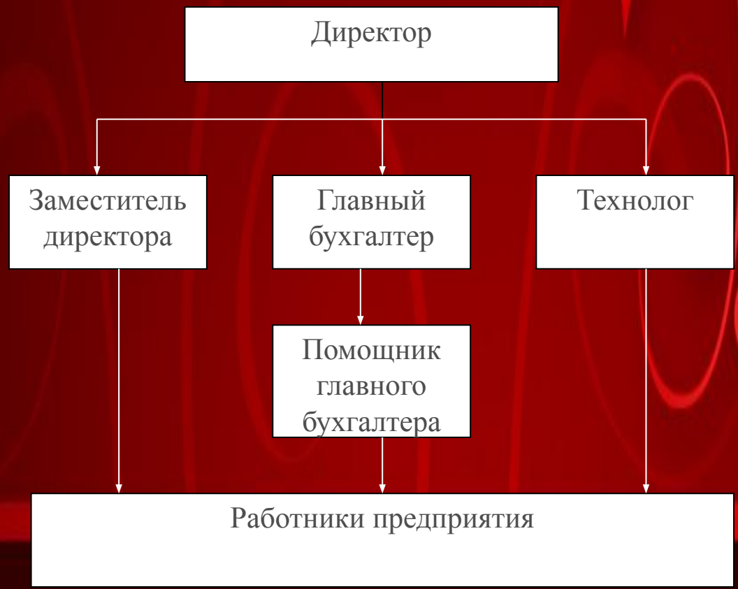
Организационная структура управления ООО «Элит»