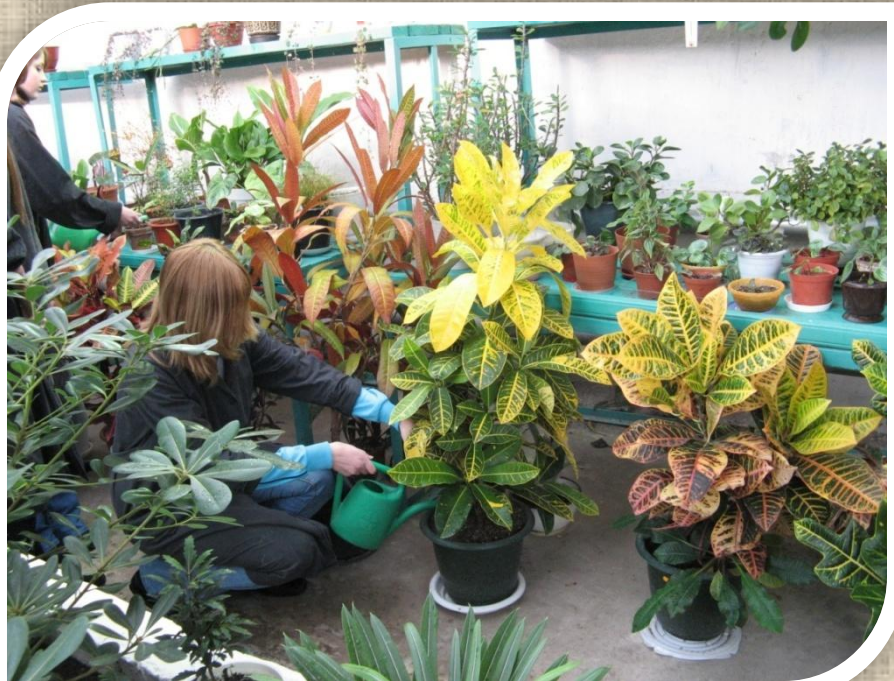
Рабочий зеленого хозяйства