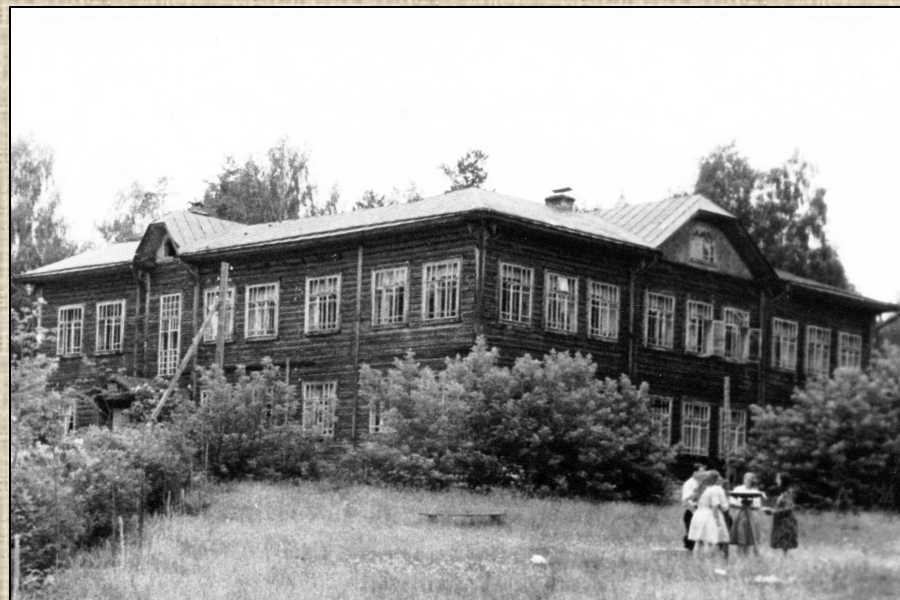
Здание учебного корпуса низшей лесной школы

Суводский лесхоз-техникум был основан в 1896 году. Это одно из старейших учебных заведений не только в области, но и в отрасли лесного хозяйства России. Сначала это была низшая лесная школа. В настоящее время – это современное государственное образовательное учреждение, расположенное в микрорайоне г. Советска Кировской области на левом берегу реки Вятка.