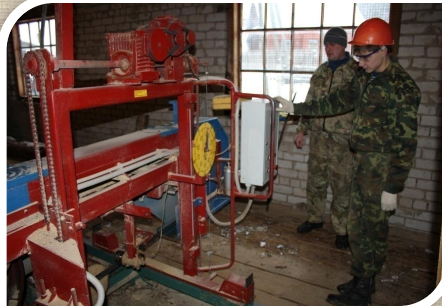
Рамщик ленточнопильных рам