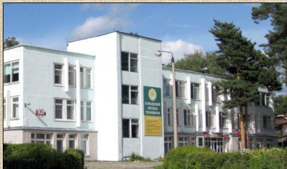
Учебный корпус лесхоза-техникума