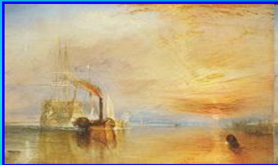
У. Тернер. Последний рейс корабля «Отважный»