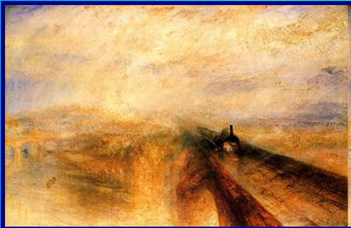
У. Тернер. Дождь, пар и скорость