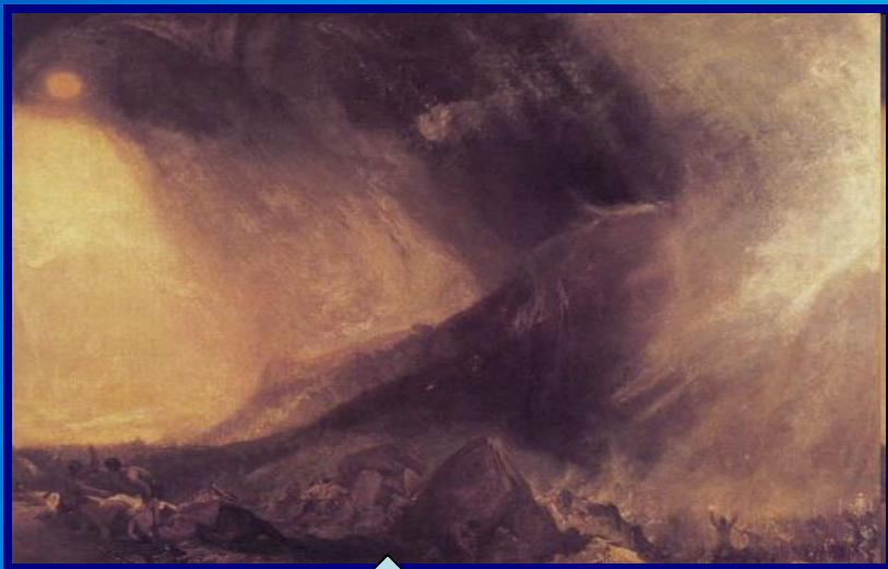
У. Тернер. Переход Ганнибала через Альпы