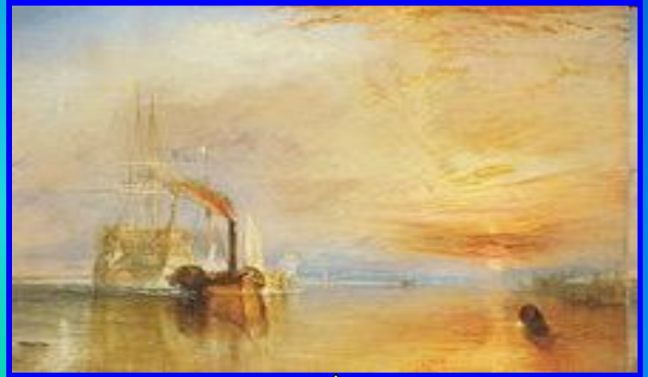
У. Тернер. Последний рейс корабля «Отважный»