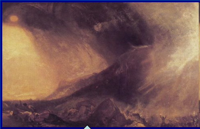
У. Тернер. Переход Ганнибала через Альпы