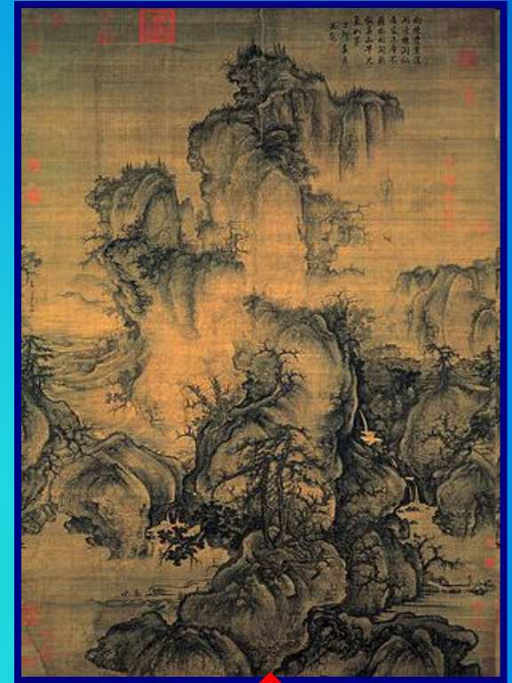
Го Си. Ранняя весна. 1072г. Гугун, Тайбэй.