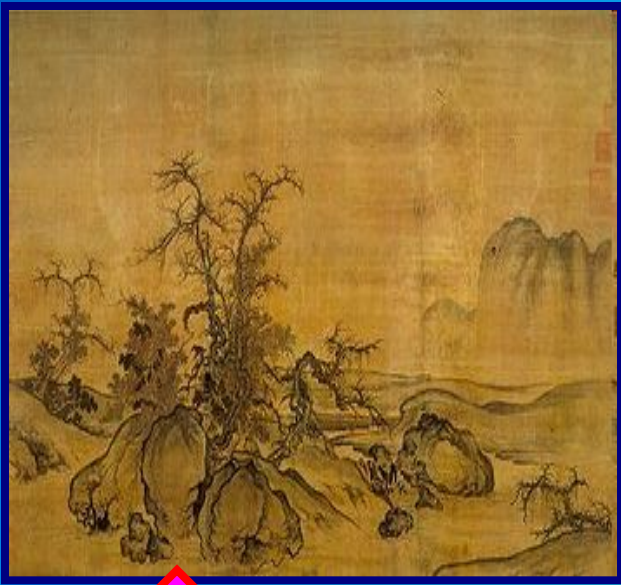
Го Си. Осень в долине реки. Фрагмент свитка. 11в. Галерея Фрир, Вашингтон.