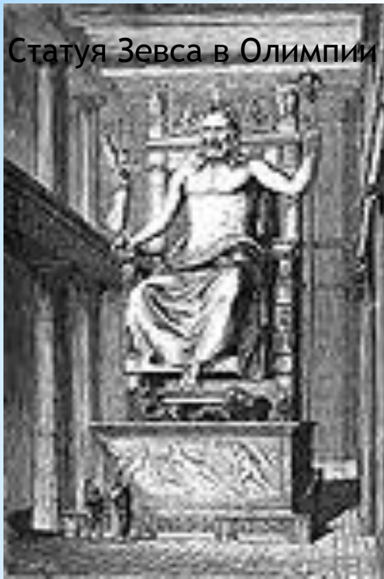
Статуя Зевса в Олимпии

* Из слоновой кости было создано тело бога. Золотом были покрыты накидка, которая закрывала часть тела Зевса, скипетр с орлом, который он держал в левой руке, статуя богини победы — Ника, которую он держал в правой руке и венок из ветвей оливы у Зевса на голове.