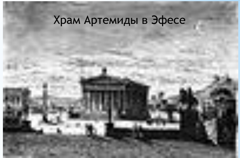
Храм Артемиды в Эфесе

Гигантские колонны достигали в высоту 20 метров. Огромные глыбы, из которых они складывались, приходилось ставить на место с помощью блоков, после чего их скрепляли металлическими штырями. Когда здание покрыла крыша, художники придали ему законченный вид, украсив скульптурами и орнаментами в которых использовали серебро и золото. В центре храма стояла статуя Артемиды.