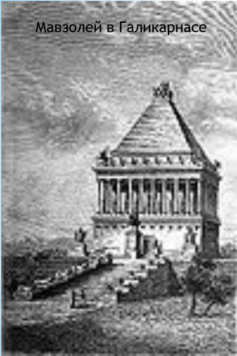
Мавзолей в Галикарнасе