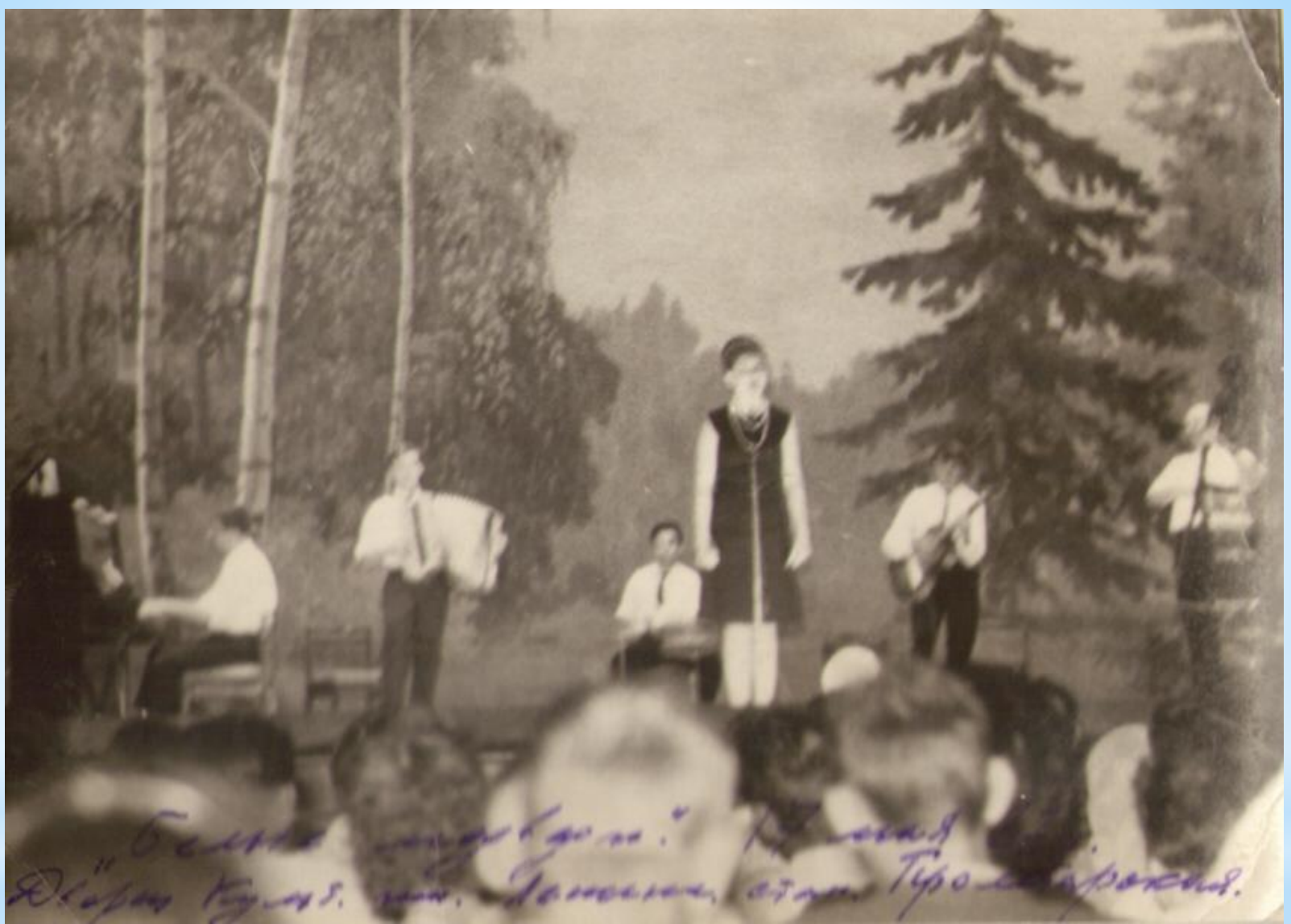
Самодеятельные коллективы Красноармейского СДК выступали с концертами по всей области.