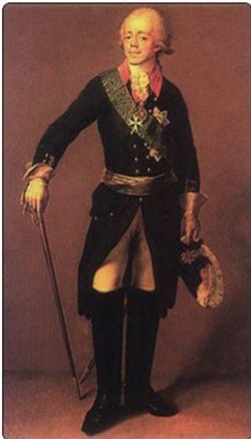
Павел I Петрович (1754-1801) российский император в 1796-1801 гг.