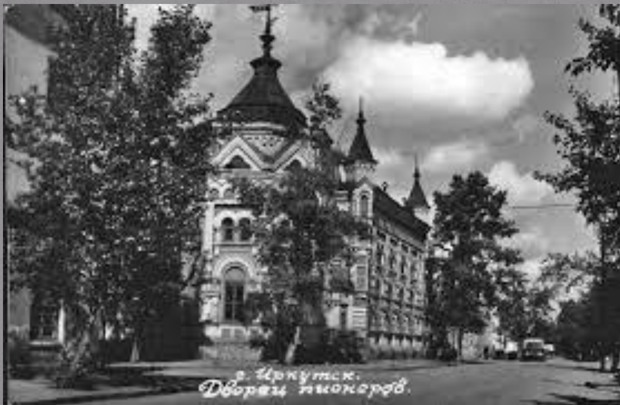
г. Иркутск. Дворец пионеров.