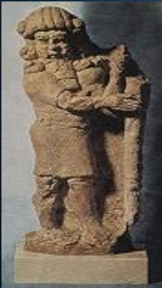
Статуэтка Гильгамешь 8 в. до н. э. Лувр Париж