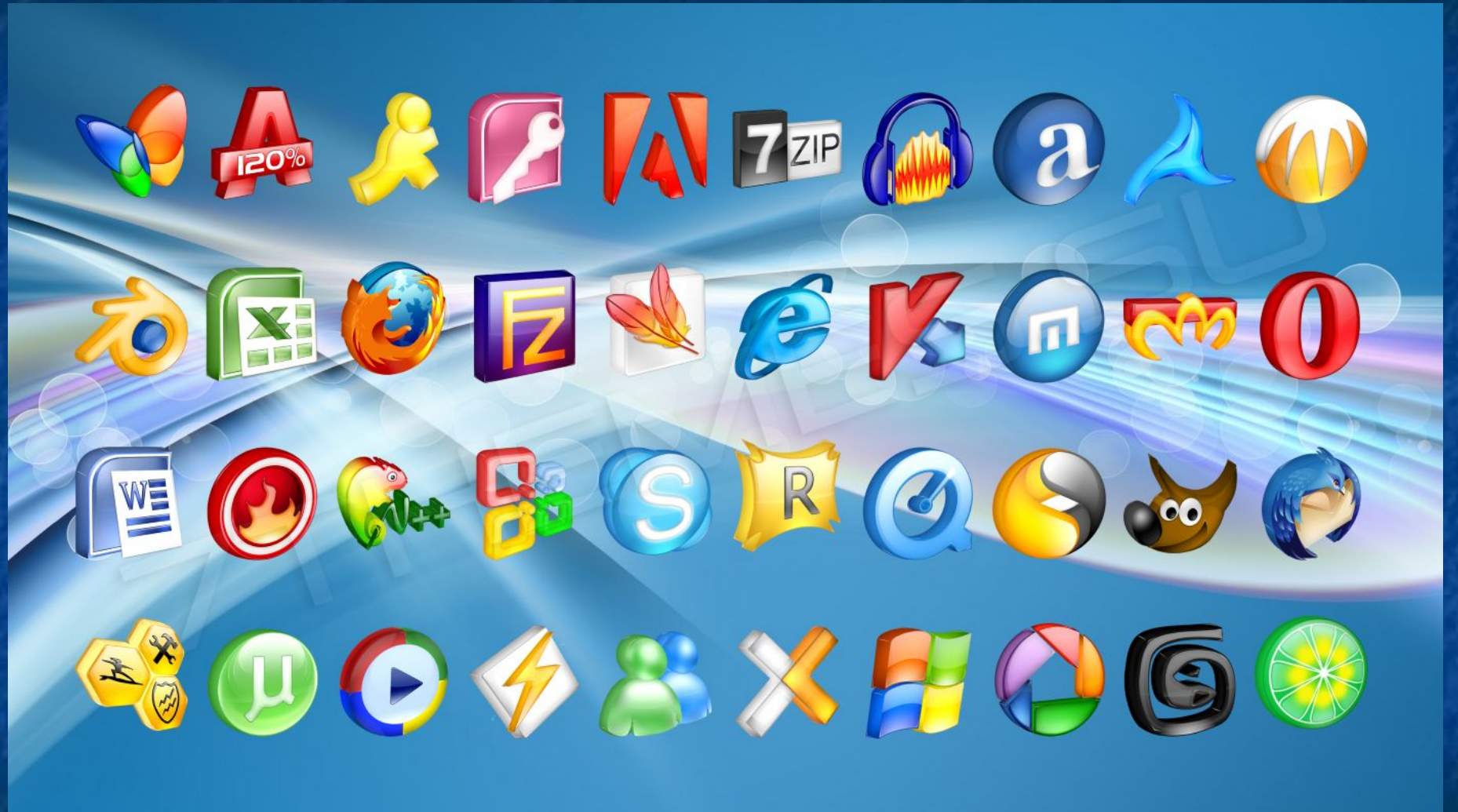
Пиктограммы информационных объектов