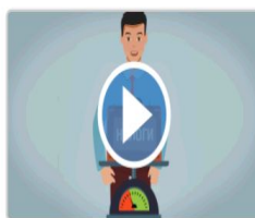
Калькулятор по расчету налоговой нагрузки

Уровень налоговой нагрузки может дифференцироваться в зависимости от отраслевой принадлежности, масштабов деятельности компании, региональных факторов, влияющих на условия ведения бизнеса. Поэтому одним из общепринятых методов определения обоснованности налоговой нагрузки компании является ее сравнение со средними значениями по отраслям экономики (*за исключением финансового и бюджетного секторов экономики, что обусловлено спецификой их налогообложения). В дальнейшем планируется реализовать возможность выбора масштаба деятельности организации.