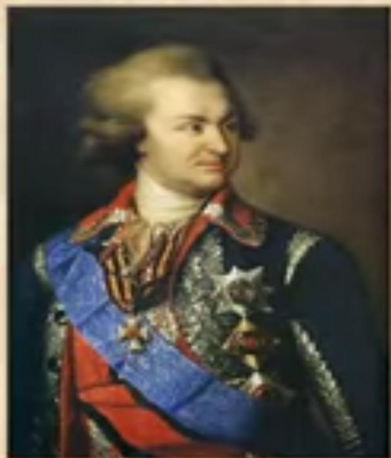
Фельдмаршал Г. А. Потемкин