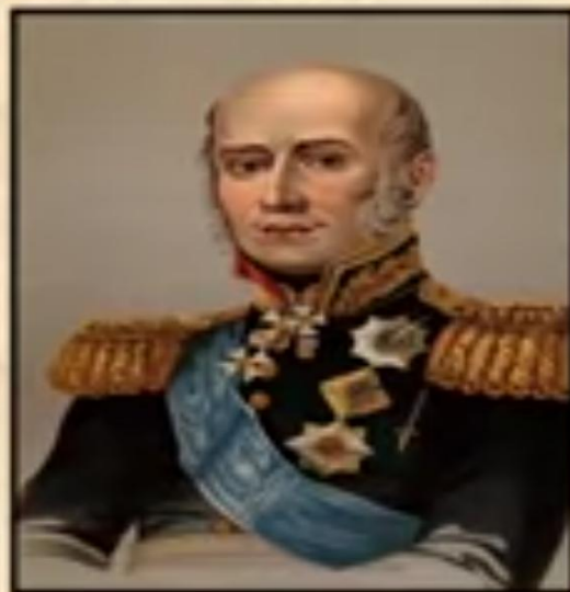
М. Б. Барклай-де-Толли Выдающийся русский полководец, генерал-фельдмаршал, военный министр, князь, герой Отечественной войны 1812 года.