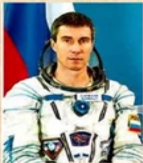
Крикалев С.К. Длительное время пробыл на орбитальной станции «Мир»