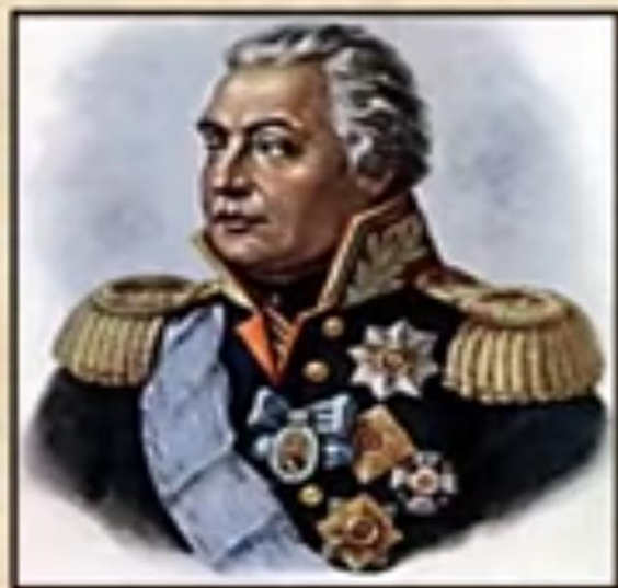
М. И. Кутузов Русский полководец, генерал-фельдмаршал, святейший князь, герой Отечественной войны 1812 года.

За всю историю России только четыре человека стали полными Георгиевскими кавалерами.