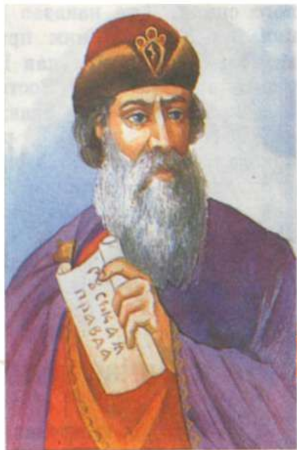
Князь Ярослав Мудрый