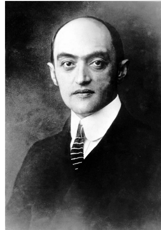
• Й. Шумпетер

Стратегия существует в сознании руководителя в виде перспективы, а именно интуитивного выбора направления движения и предвидения будущего организации. Процесс формирования стратегии можно назвать полусознательным; он базируется на жизненном опыте и интуиции руководителя независимо от того, рождается идея в его сознании или он воспринимает ее извне