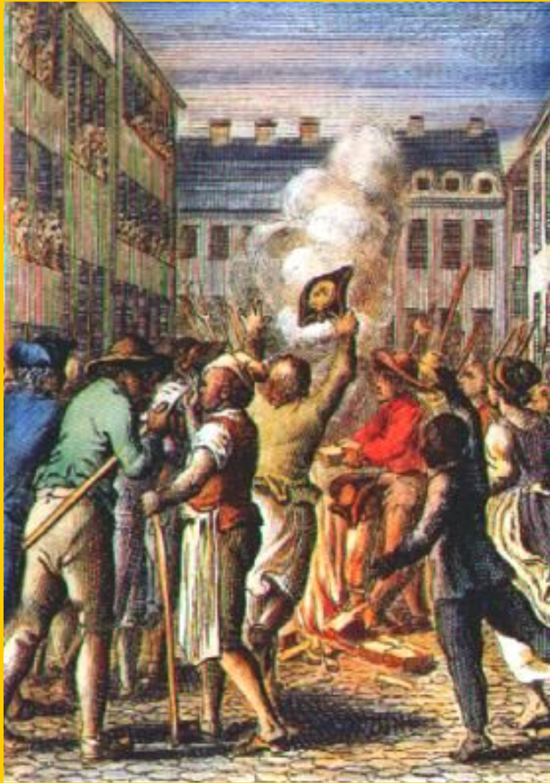
«Нет-гербовому сбору!» Гравюра 18 в.

В 1763 г. Георг III запретил колонистам переселяться за Аллеганские горы. Вскоре был принят закон о гербовом сборе. В колониях размещались войска для «борьбы с индейцами».