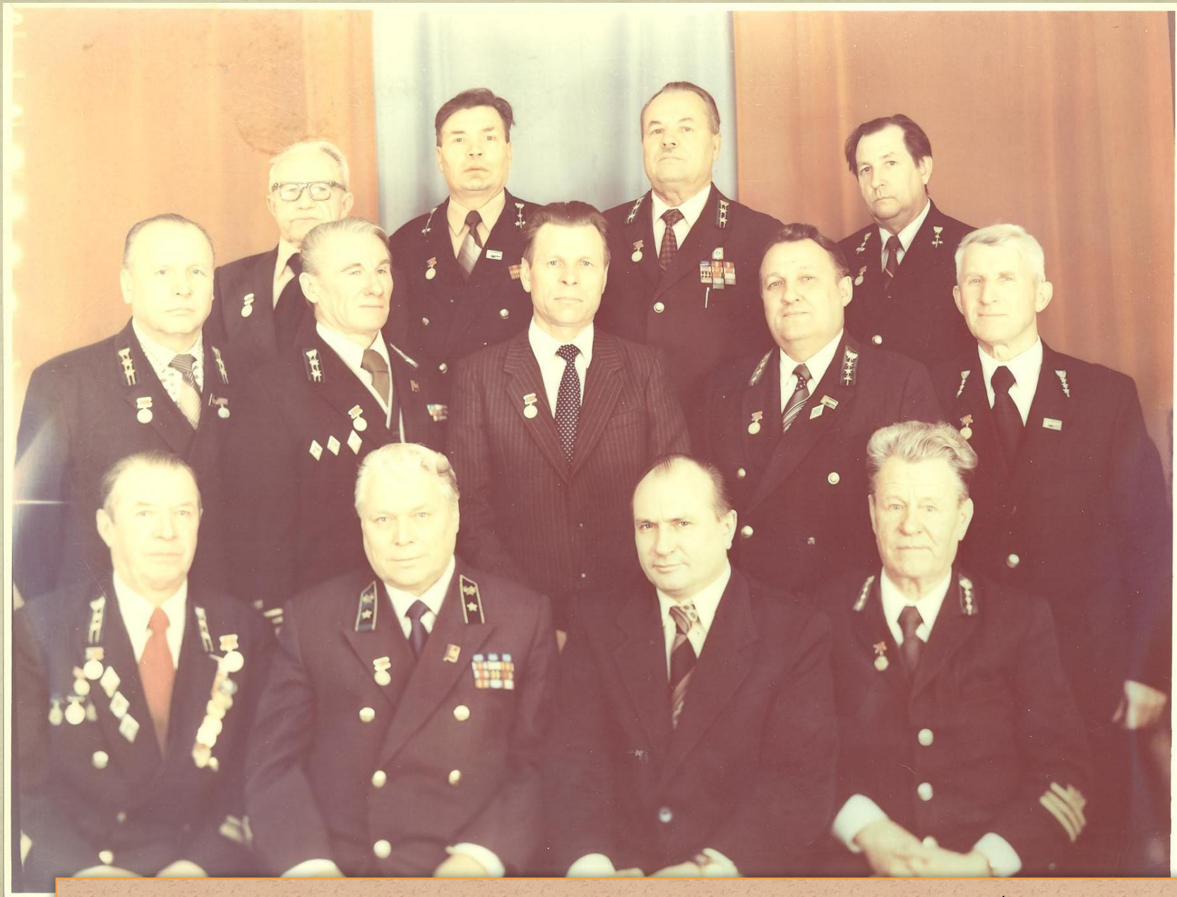
Заслуженные лесоводы Горьковской области