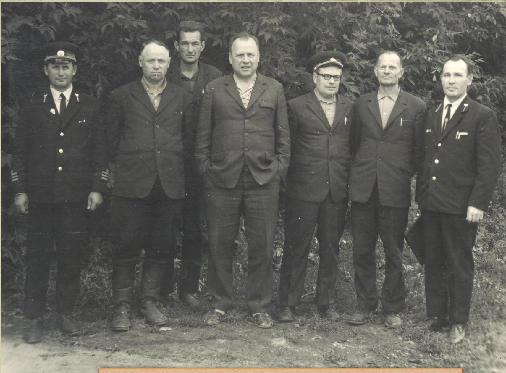
Работники Сергачского лесхоза