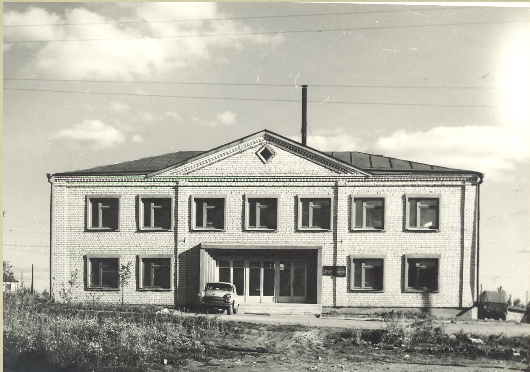
Новая контора Сергачского лесхоза