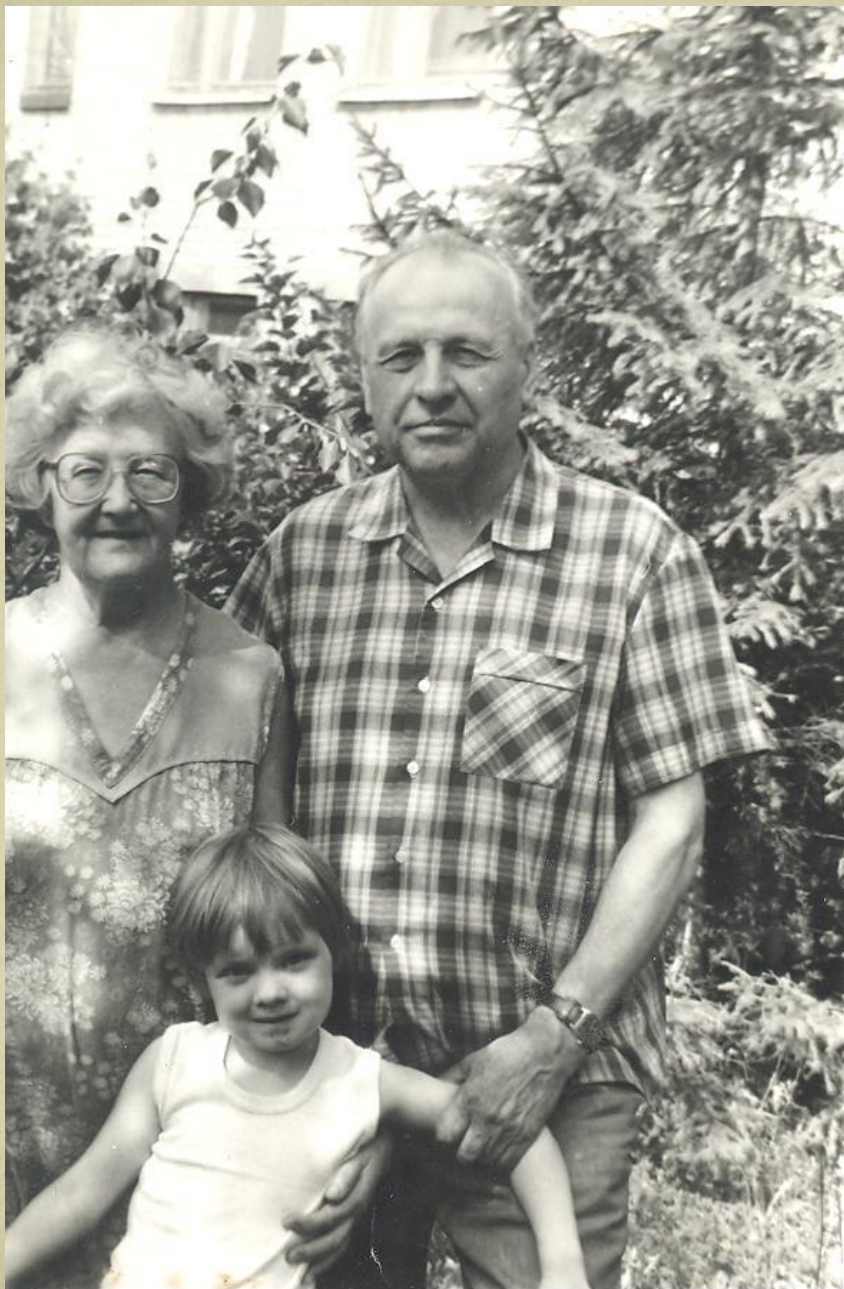
Супруги Черепановы с внучкой