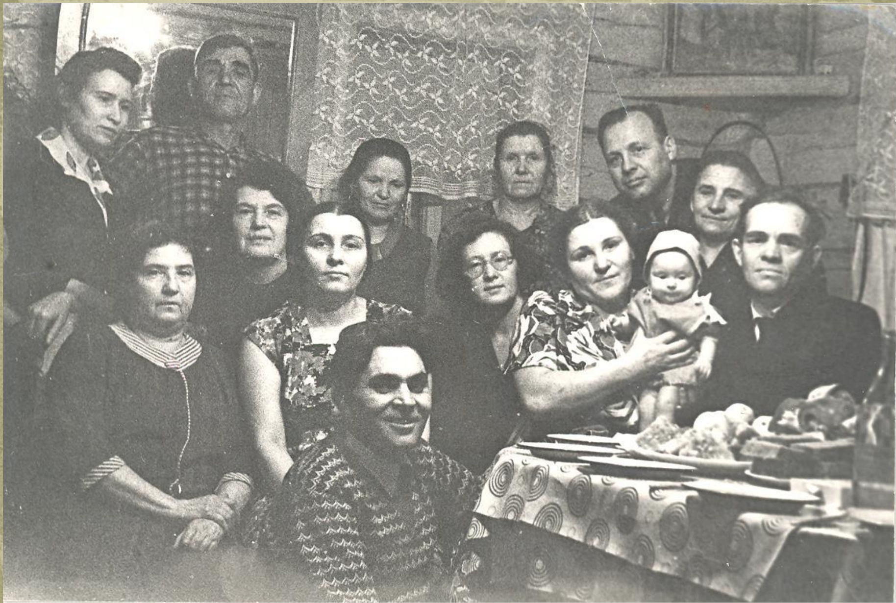
В гостях у знакомых в Гусеве