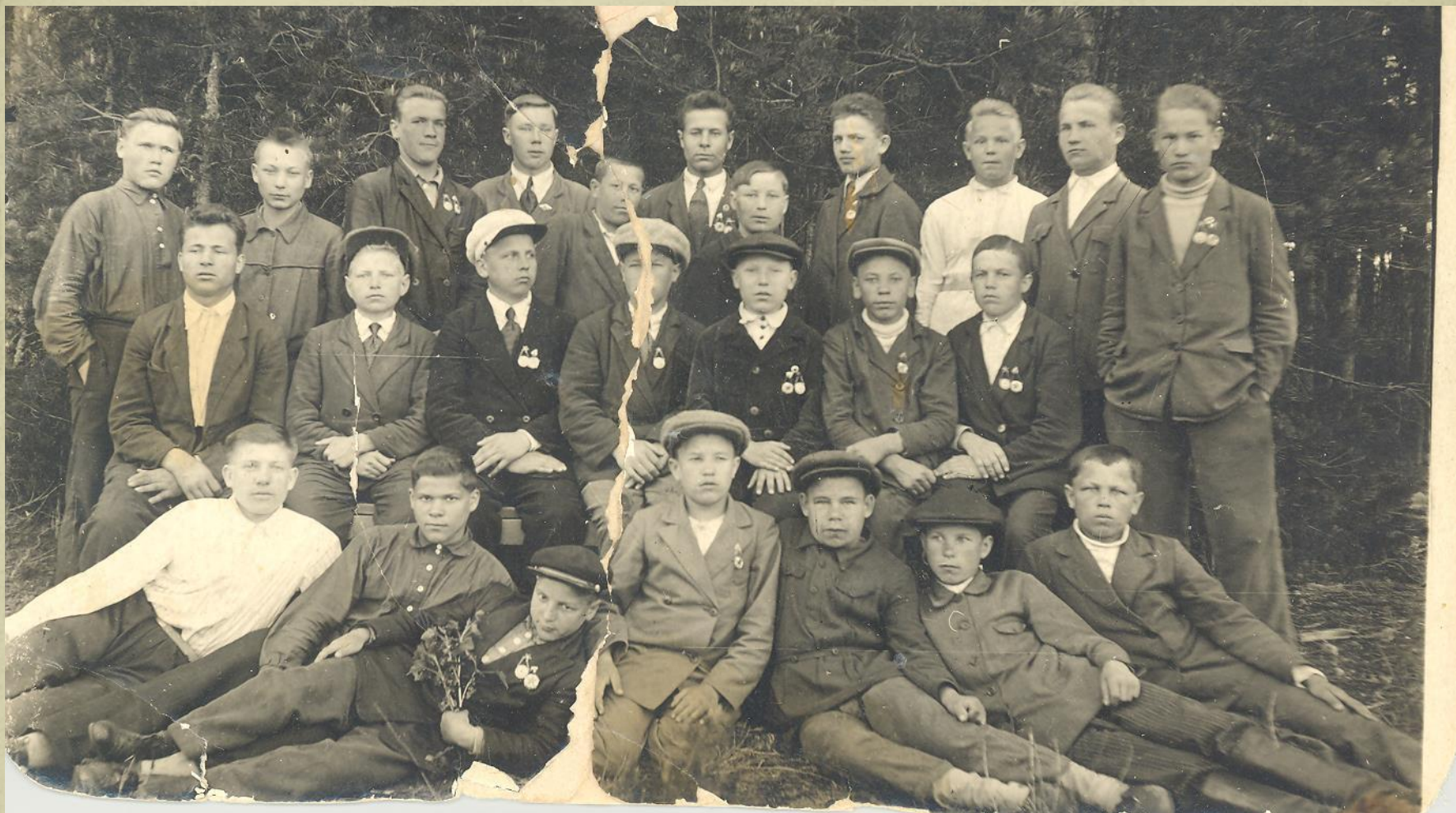
Годы учебы в лесном техникуме