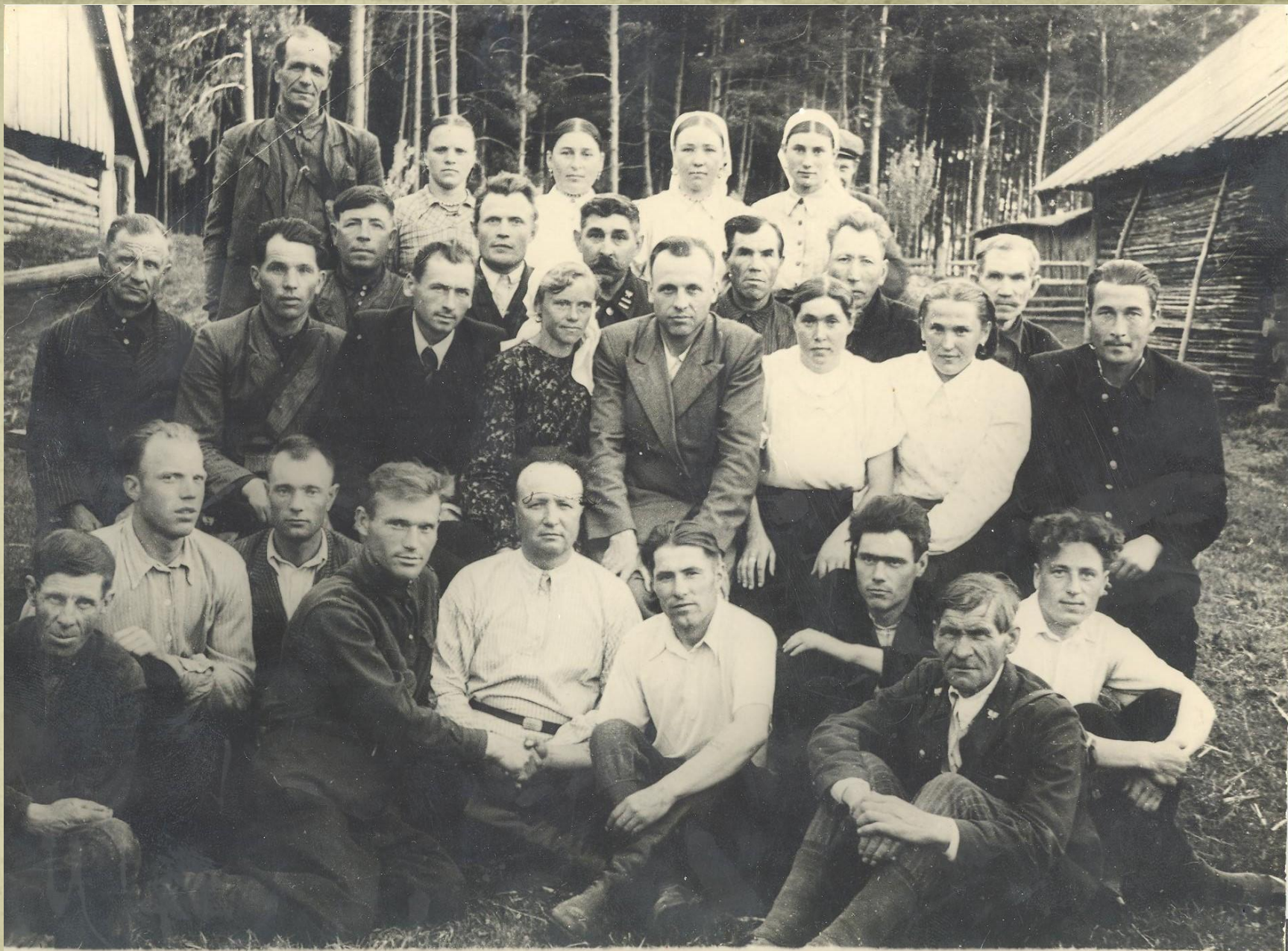
Коллектив Березниковского лесхоза