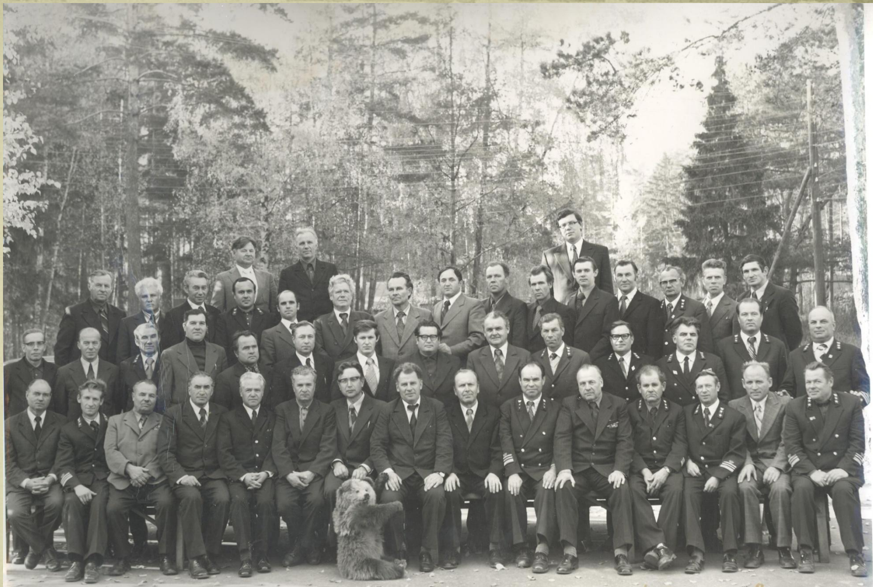
Семинар - совещание руководящих работников Торжокского управления лесной экономики по вопросам труда Октябрь 1979 год "Земный образ"