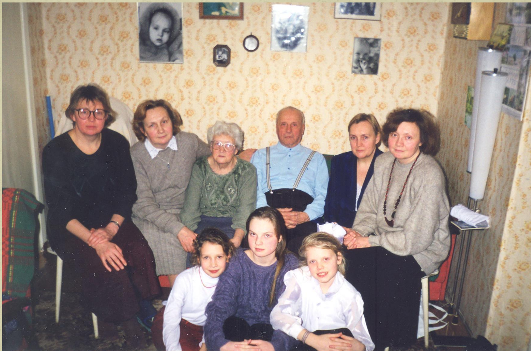
В кругу семьи