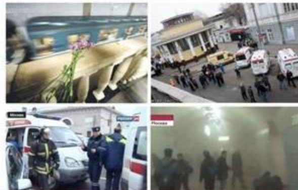
ВЗРЫВЫ НА СТАНЦИЯХ МЕТРО "ЛУБЯНКА" и "ПАРК КУЛЬТУРЫ"

Не спешите сразу уйти домой. Сначала свяжитесь с врачами. Врачи помогут выйти из шока и, если нужно, предоставят необходимое лечение. Помните: после того, как вас спасли, вам необходима медицинская помощь.