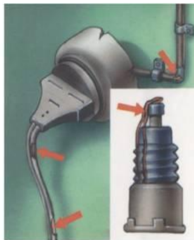
Неисправность электропроводки Пользование самодельными предохранителями