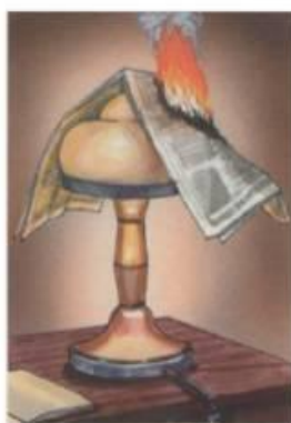
Затемнение электроламп сгораемыми материалами (бумагой, тканью)