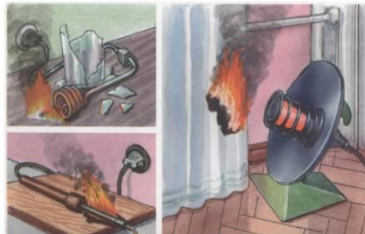
Оставление без присмотра электрических нагревательных приборов