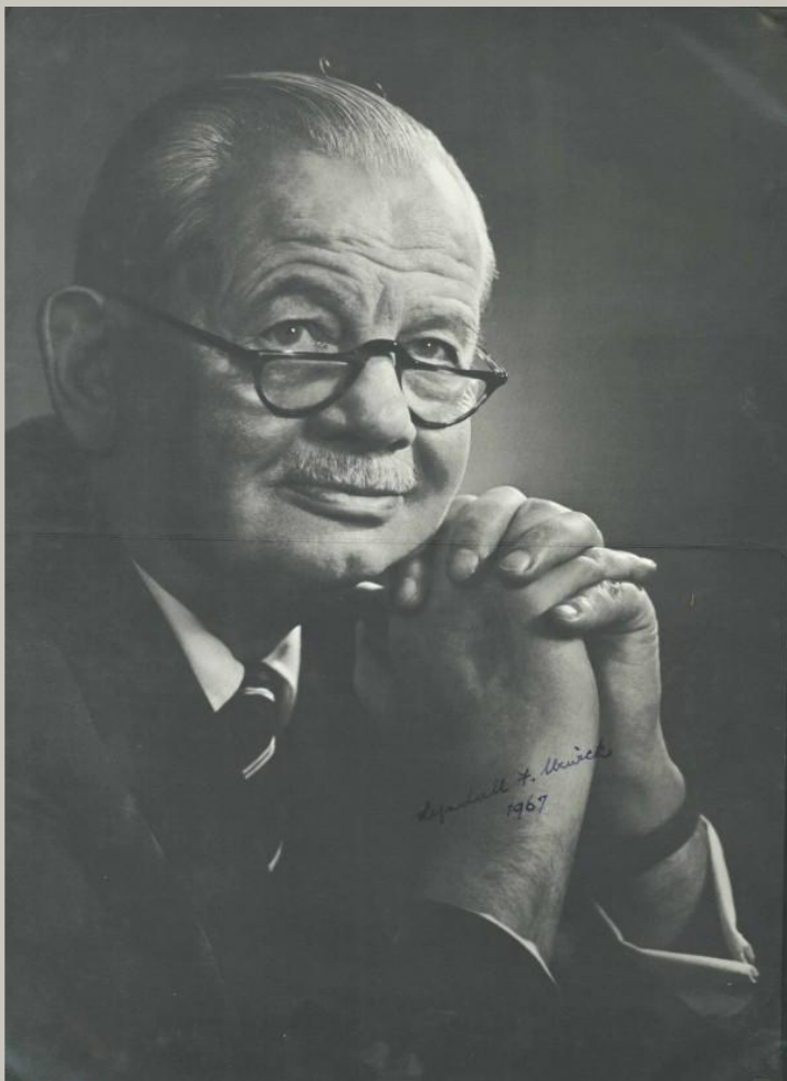
Линдал Урвик (1891 – 1983 гг): “Понятие рационализации”, “Основы администрирования” и другие