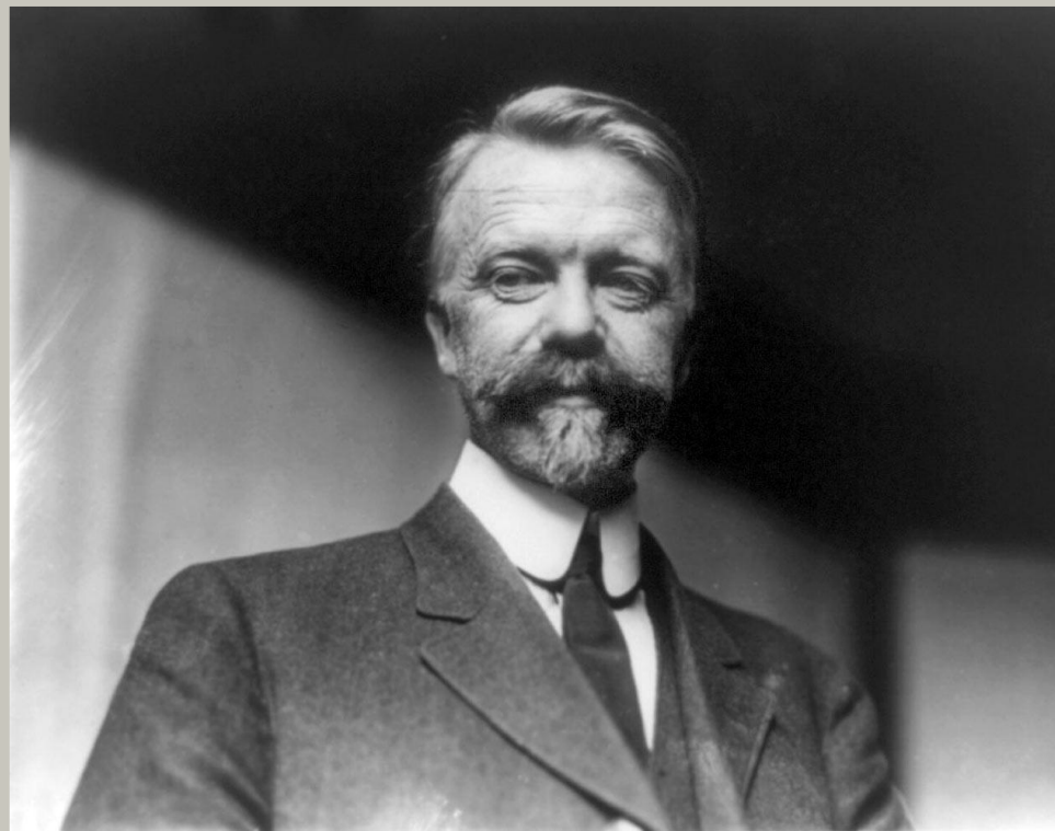
Лютер Гьюлик (1892-1993 гг): “Записки об основах администрирования” (совместно с Л. Урвиком)