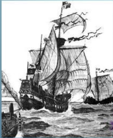
Корабли экспедиции Христофора Колумба

Христафор Колумб – первый мореплаватель эпохи Великих географических открытий, который отважился пересечь Атлантический океан