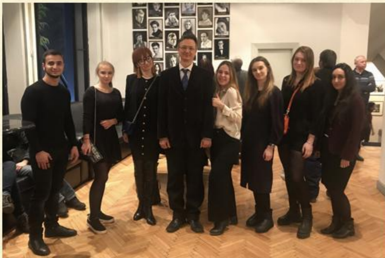
КСП на спектакле «Свидетель обвинения»