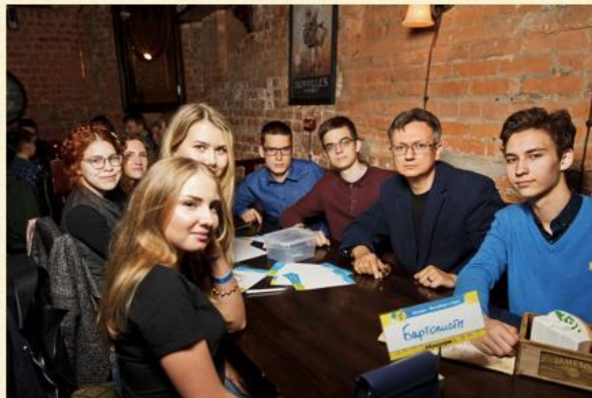
КСП на интеллектуальной викторине «Квизиум»