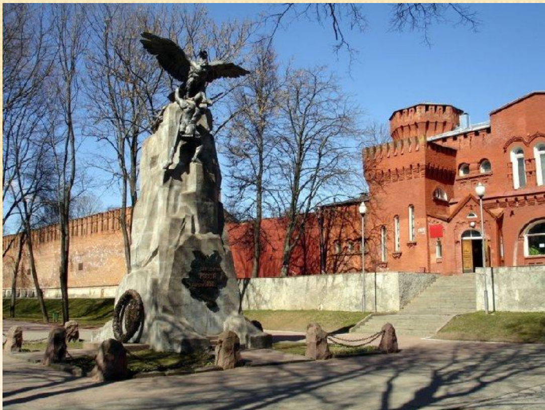
Памятник защитникам Смоленска