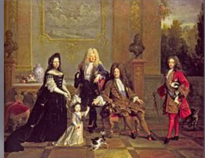
Николя де Ларжийер. Портрет Людовика XIV с семьёй

Мода эпохи барокко соответствовала моде во Франции периоду правления Людовика XIV, второй половине XVII века. Это время абсолютизма. При дворе царили строгий этикет и сложный церемониал. Костюм был подчинен этикету. Франция была законодателем моды в Европе, поэтому в других странах быстро переняли французскую моду. Это был век, когда в Европе установилась общая мода, а национальные особенности отошли на задний план или сохранились в народном крестьянском костюме. До Петра I европейские костюмы носили также и в России некоторые аристократы, хотя не повсеместно.