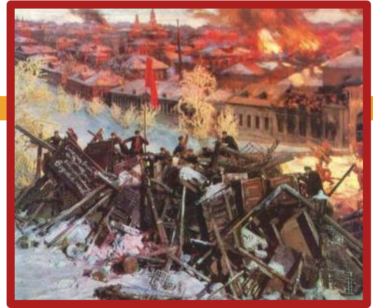
Диорама Героическая Красная Пресня.

В начале была объявлена всеобщая забастовка. Был блокирован железнодорожный узел. Москвичей поддержали рабочие Петербурга. К 10 декабря стачка переросла в вооруженное восстание. Его центром стала Пресня. На подавление восстания из Петербурга правительство прислало Семеновский полк. Восстание было локализовано в в р-не Пресни и 19 декабря Моссовет принял решение о его прекращении. По городу