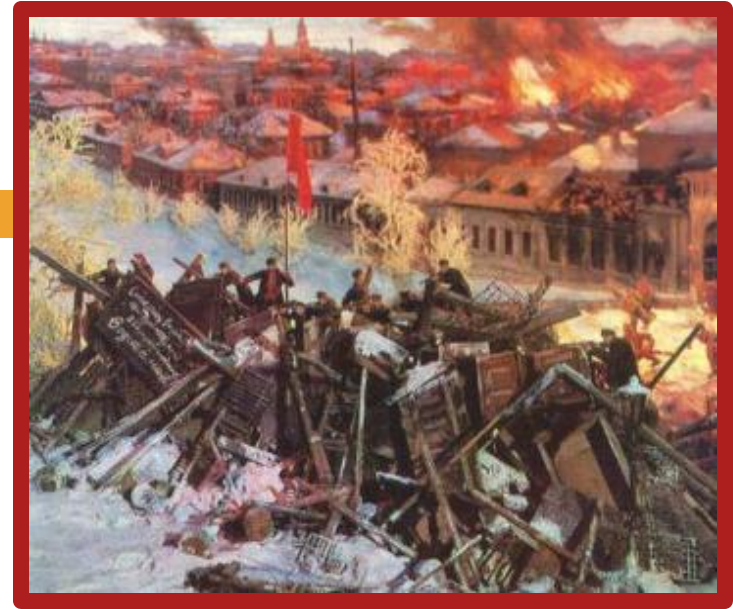
Диорама Героическая Красная Пресня.

В начале была объявлена всеобщая забастовка. Был блокирован железнодорожный узел. Москвичей поддержали рабочие Петербурга. К 10 декабря стачка переросла в вооруженное восстание. Его центром стала Пресня. На подавление восстания из Петербурга правительство прислало Семеновский полк. Восстание было локализовано в в р-не Пресни и 19 декабря Моссовет принял решение о его прекращении. По городу