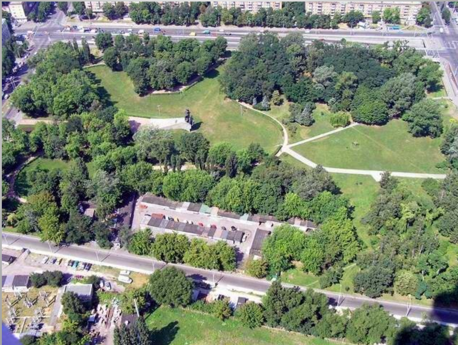
Бабий Яр находится в северно-западной части Киева

Бабий Яр получил всемирную известность как место массовых расстрелов населения, в основном евреев, и советских пленников, проводимых немецкими войсками в 1941 году. Всего было расстреляно, по информации из разных источников, от 33 тысяч до 100 тысяч человек