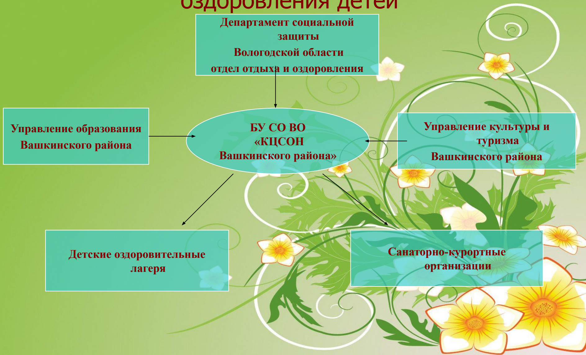
Схема взаимодействия БУ СО ВО «КЦСОН Вашкинского района» по организации отдыха и оздоровления детей