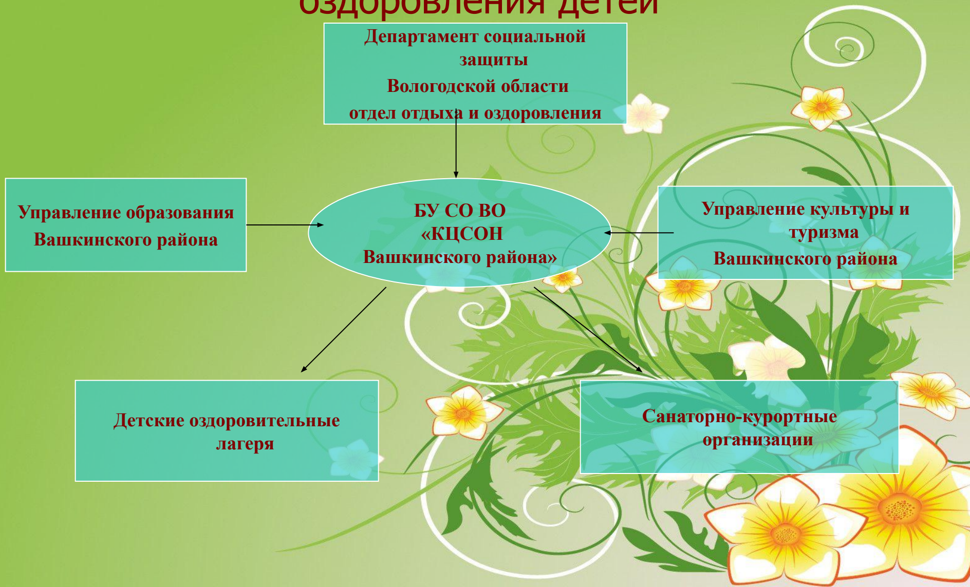
Схема взаимодействия БУ СО ВО «КЦСОН Вашкинского района» по организации отдыха и оздоровления детей