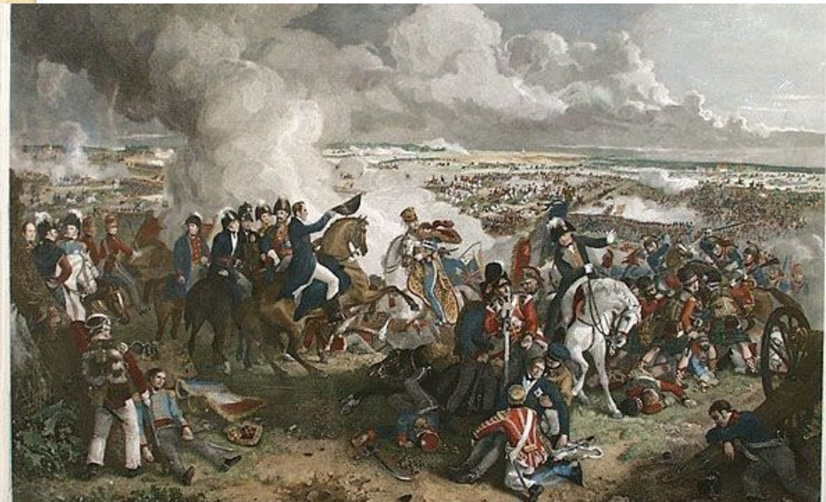
● Bitwa pod Waterloo