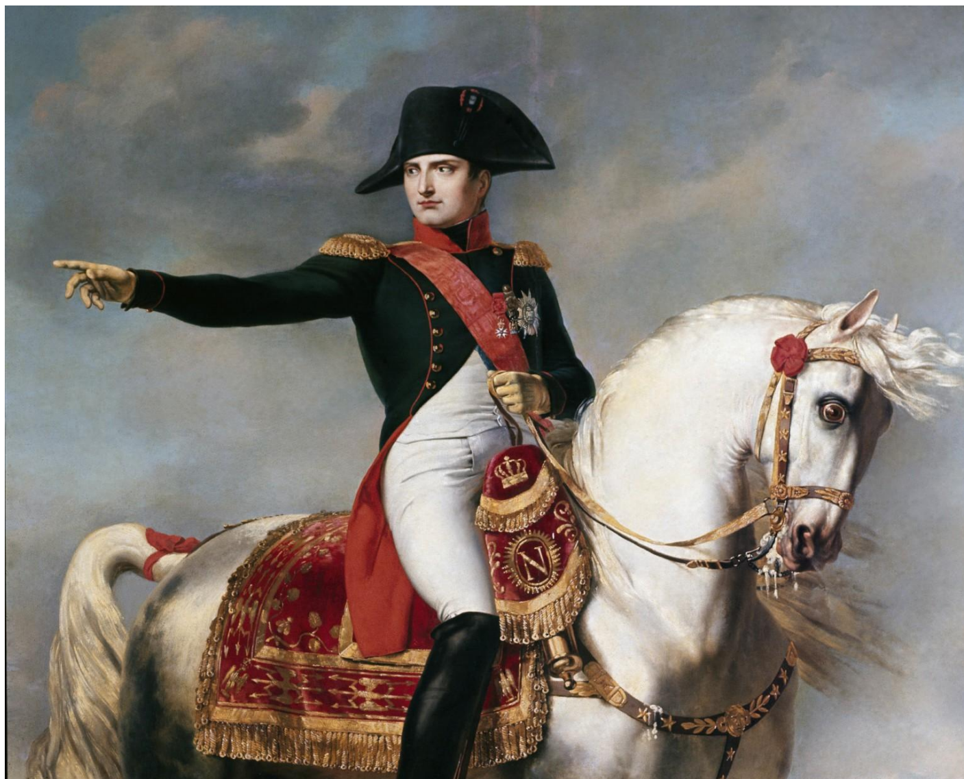
Napoleon Bonaparte (ur. 1769 w Ajaccio na Korsyce, zm. 1821 na Wyspie Świętej Heleny.)