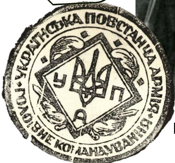
Ріхард (Ріко) Ярій