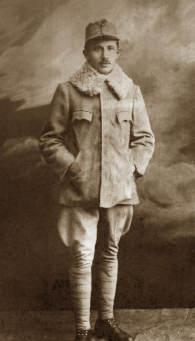
Євген (Евген) Михайлович Коновалець

Був посередником між німецькою розвідкою і ОУН. Від 1937 зв'язковий полковника Євгена Коновальця до адмірала В. Канаріса , шефа Абверу Німеччини.