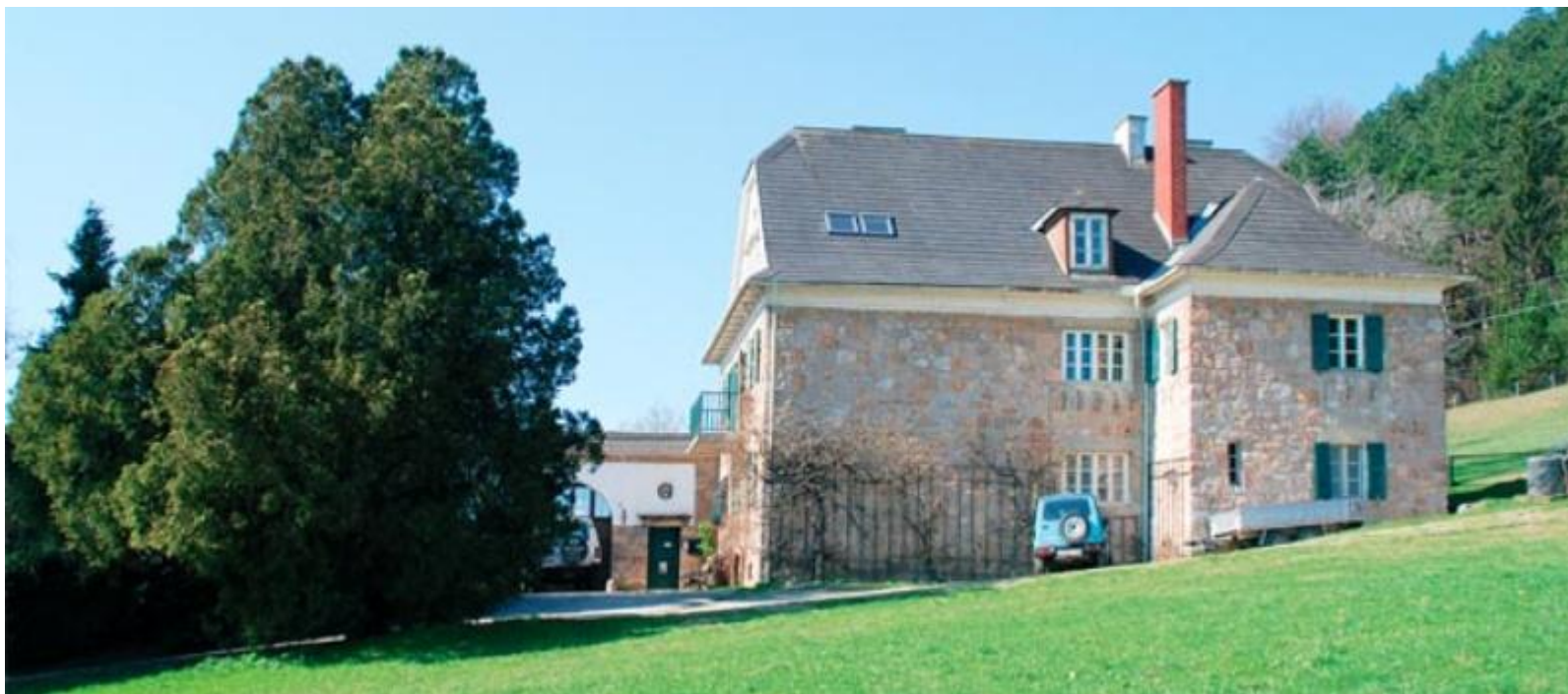
Маєток Ґастайль . Нині біоферма.

16 вересня був заарештований Ґестапо за «український сепаратизм»; був звільнений через кілька тижнів, взятий під домашній арешт. Від поліційного нагляду був звільнений 15 лютого 1943 року, отримав право жити у власній посілости (маєтку) Ґастайль в районі Земмерінґу (Австрія).