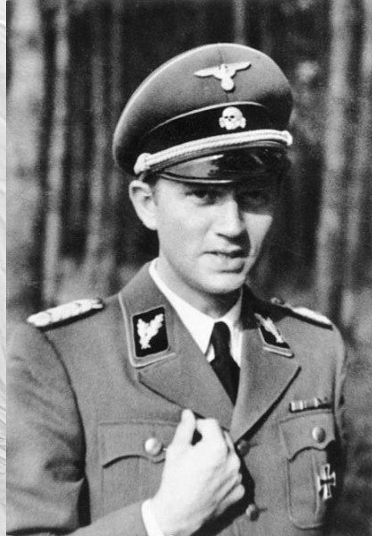
Вільгельм Франц Канаріс

Був посередником між німецькою розвідкою і ОУН. Від 1937 зв'язковий полковника Євгена Коновальця до адмірала В. Канаріса , шефа Абверу Німеччини.