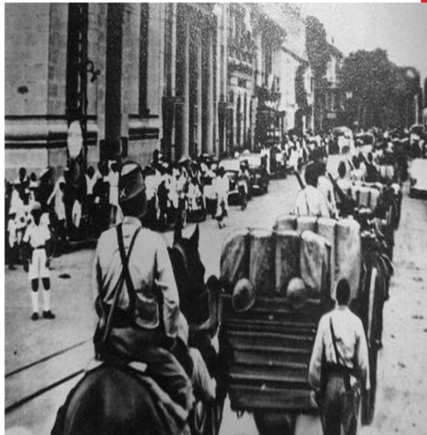
Японские войска входят в Сайгон

. 22 сентября 1940 года между Францией и Японией заключено соглашение о размещении японских войск в Северном Индокитае. Воспользовавшись поражением Франции на начальных этапах Второй мировой войны, Таиланд попытался вернуть утраченные ранее территории. Несмотря на то, что французы в целом воевали успешнее, под давлением Японии Франция была вынуждена удовлетворить требования Таиланда.