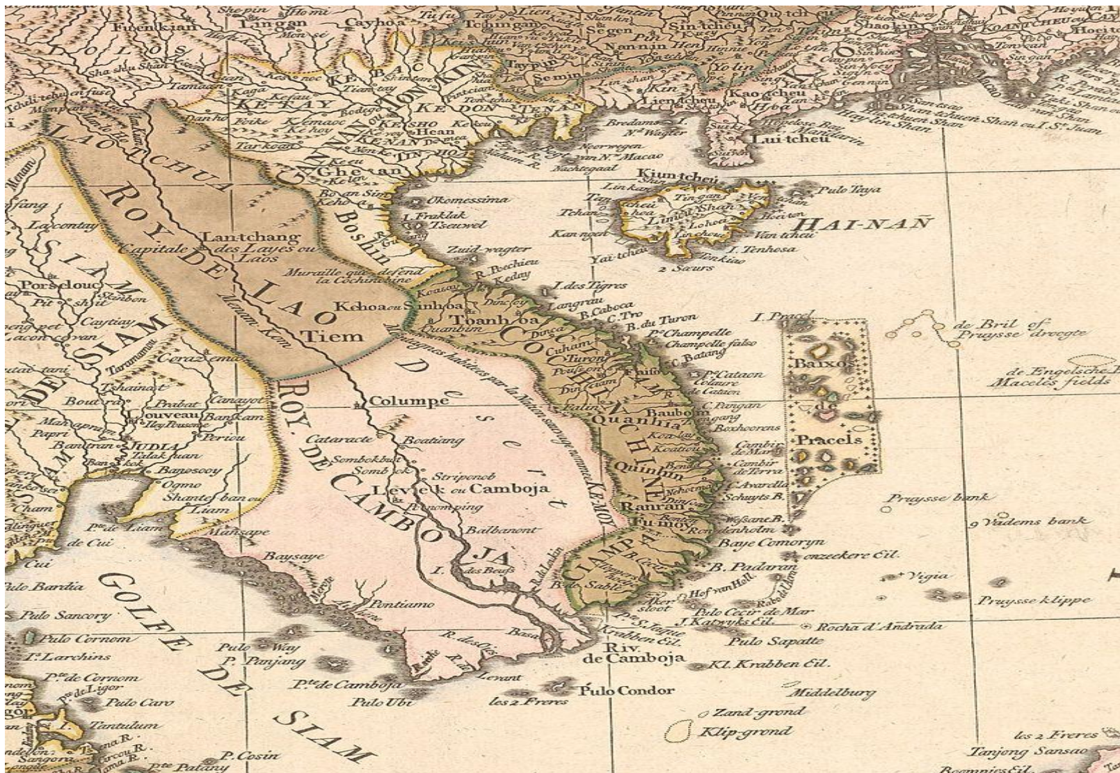
Карта Индокитая XVIII века, опубликованная в Амстердаме ок. 1760 года.