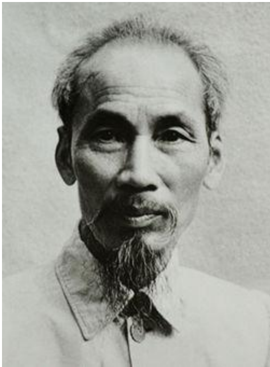
Хо Ши Мин (1890-1969) основатель Коммунистической партии Вьетнама, первый президент Северного Вьетнама.

3 февраля 1930 г. при активном участии Хо Ши Мин в Гонконге проводится конференция, на которой происходит объединение различных коммунистических групп и основание Коммунистической партии Вьетнама («Вьетнам конг шан данг»).