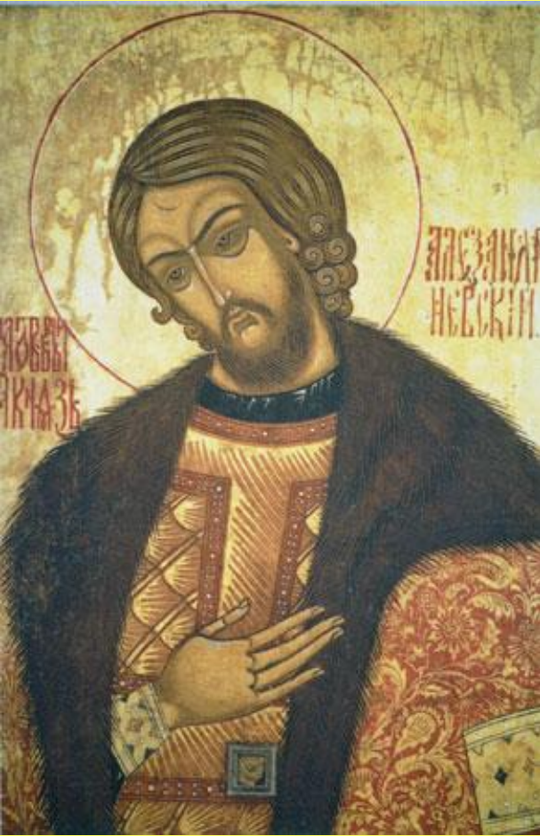
Святой благочестивый князь Александр Невский. Икона.

В 1257 г. Орда провела на Руси перепись населения – «число».