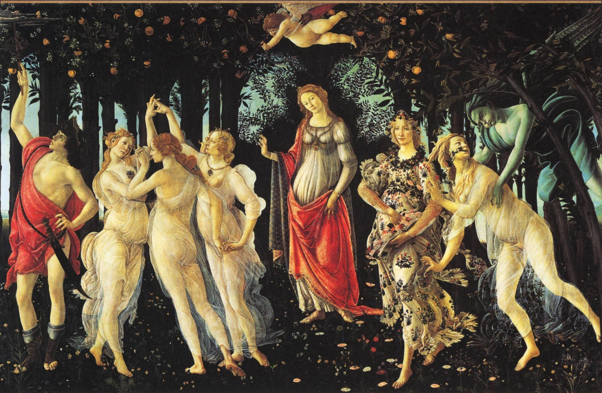
«Весна» («Primavera») 1478 г.