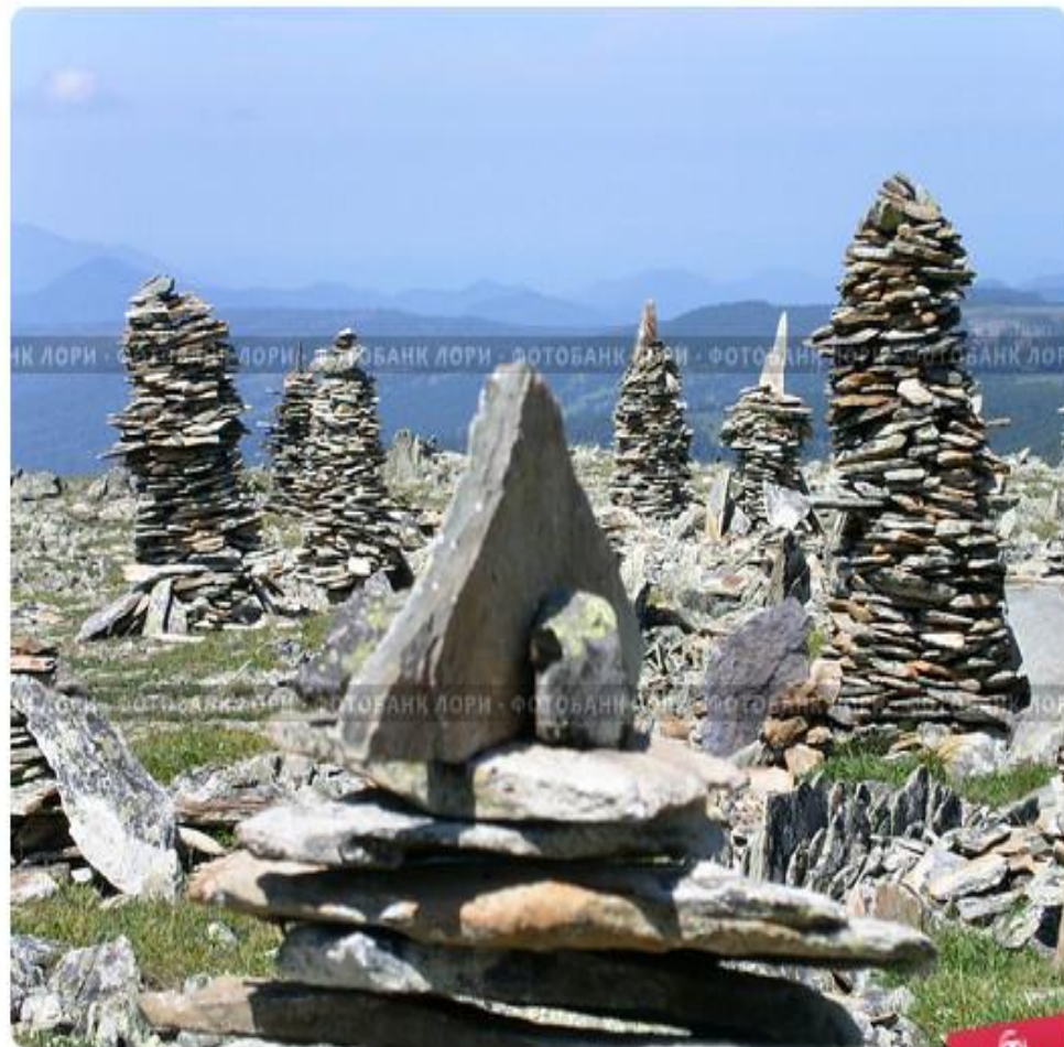
Туры, Алтай