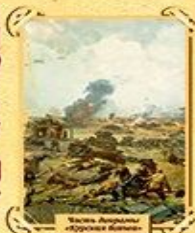
Часть картины «Курская битва»

12 июля состоялось самое крупное в истории войн танковое сражение под деревней Прохоровкой (Белгородская область) с обеих сторон участвовало 1200 танков и самоходных орудий.