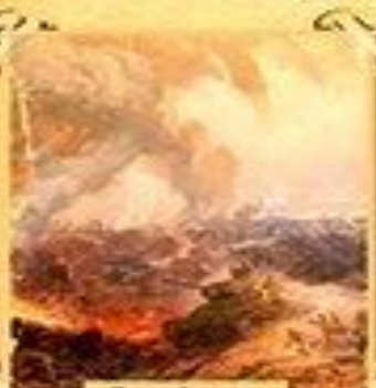
Часть картины «Курская битва»