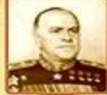
ЖУКОВ Георгий Константинович

В планы немецкого командования на Курской дуге входило окружение и разгром войск Центрального и Воронежского фронтов Советской Армии и нанесение удара в тыл Юго-Западного фронта. Тем самым они рассчитывали взять реванш за Сталинград. Им была разработана операция «Цитадель». Советское командование, в свою очередь, разработало свой план боевых действий. Вам достигнут значительный перевес в людских силах и боевой технике. В тылу Воронежского и Центрального фронтов был образован самый стратегический резерв - Степной фронт.