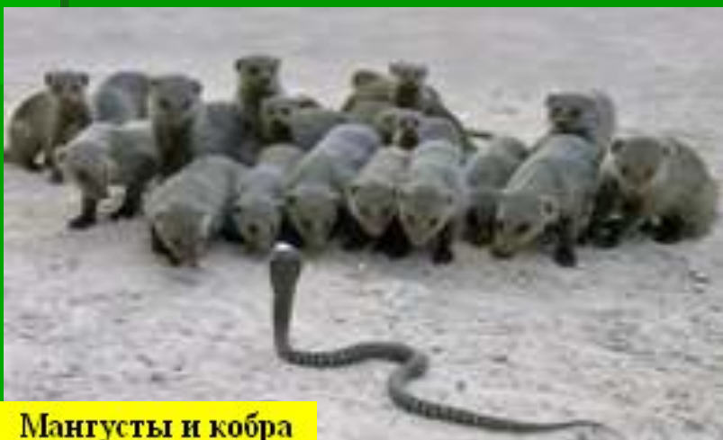
Мангусты и кобра