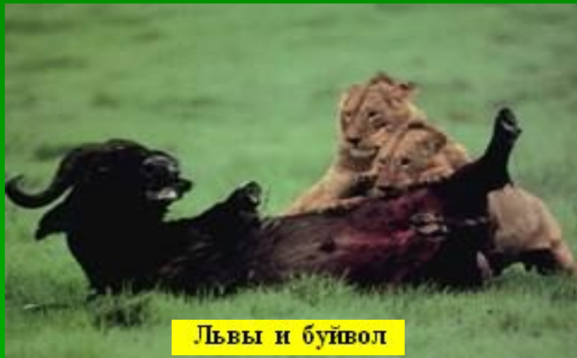
Львы и буйвол