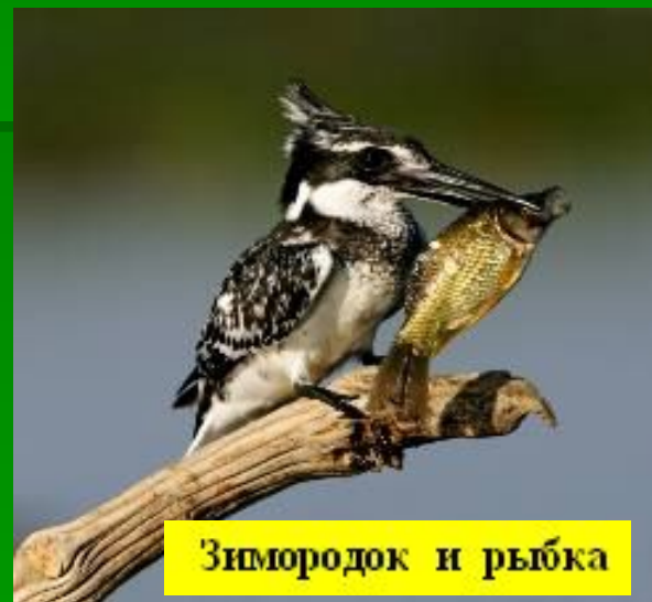
Зимородок и рыбка