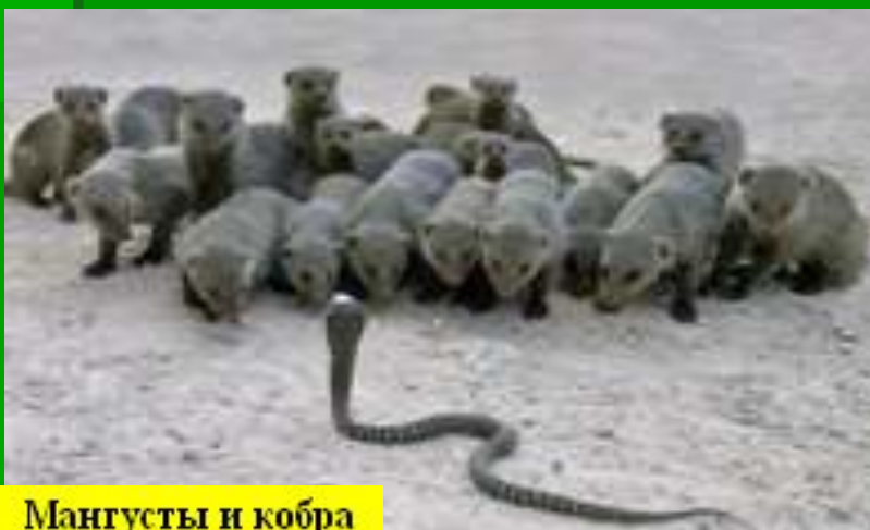
Мангусты и кобра