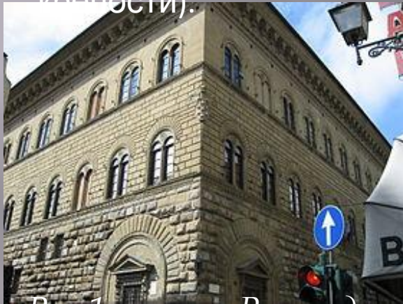
Рис.1 палаццо Риккарди

Всем зданиям присущи характерные черты сооружений эпохи Возрождения (массивность и прочность, что придавало жилым зданиям дух крепости).