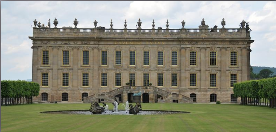
Рис.1 вилла герцога Девоншайрского

В царствование Якова I (1603-1625) классические формы в строительстве Англии получили наибольшее распространение. К наиболее выдающимся архитектурным сооружениям этого периода относятся: вилла герцога Девоншайрского в Чизвике (Рис.1), дворец в Уайт-Холл (Рис.2), сооруженный для Карла I, и другие. Оба этих здания сооружены по проекту Английского архитектора Иниго Джонса