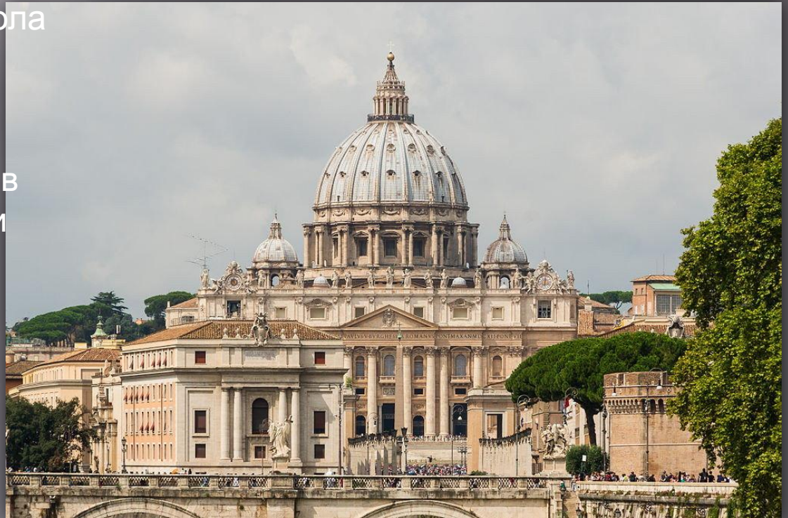
Рис.1 собора Св. Петра

В 1558 г. Микеланджело составил новое решение центрального купола пролетом 44 м. Широкое применение железа в строительном деле того времени, явившееся результатом перехода от получения сварочного железа в кричном горне к переделу железа из чугуна в домашней печи, дало возможность Микеланджело в составленном им проекте купола применить железное растяжное кольцо. Это дало возможность отказаться от массивных стен и контрфорсов и поставить купол в виде чаши и фонаря на цилиндрическом барабане со связанными парами колоннами.