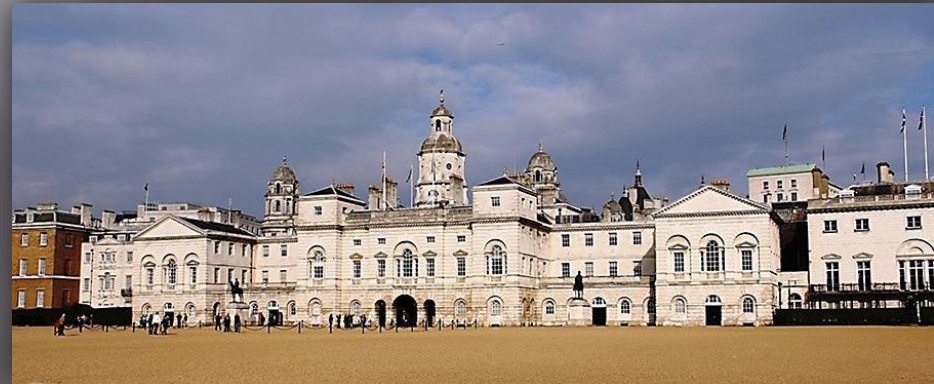
Рис.2 дворец в Уайт- Холл