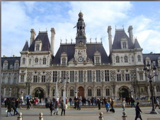
Рис.1 городская дума

В Париже в стиле Ренессанса итальянскими и французскими зодчими были построены здания, из которых наиболее выдающимися являются: городская дума (Рис.1), дворец Тюильри (Рис.2), Люксембургский дворец (Рис.3), Версальский дворец (Рис.4) и Дом инвалидов.