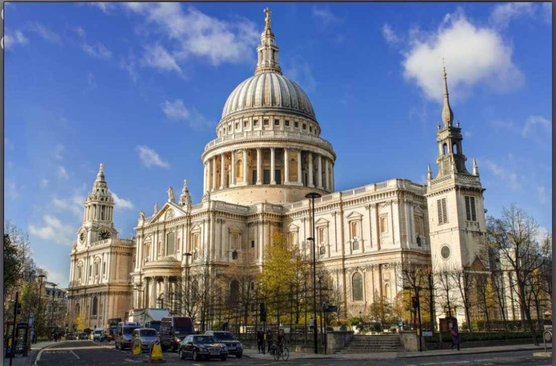
Рис.1 собор Св. Павла в Лондоне

Внутренний купол собора выложен из кирпича в форме полушария с отверстием в вершине диаметром 11 м. Деревянная конструкция камня фонаря несет на себе расположенный между двумя куполами кирпичный конус. Таким образом, основная конструкция купола собора – внутренний купол и расположенный в центре конус остаются невидимыми.