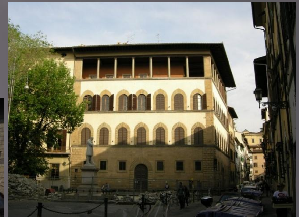
Рис.3 палаццо Гваданьи