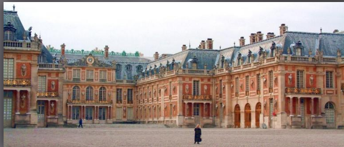
Рис.4 Версальский дворец