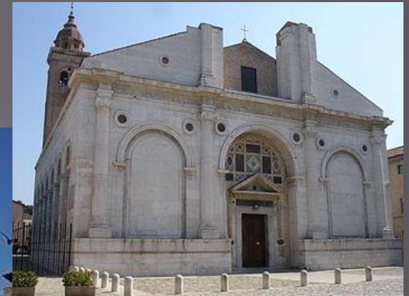
рис.2 Темпио Малатестиано