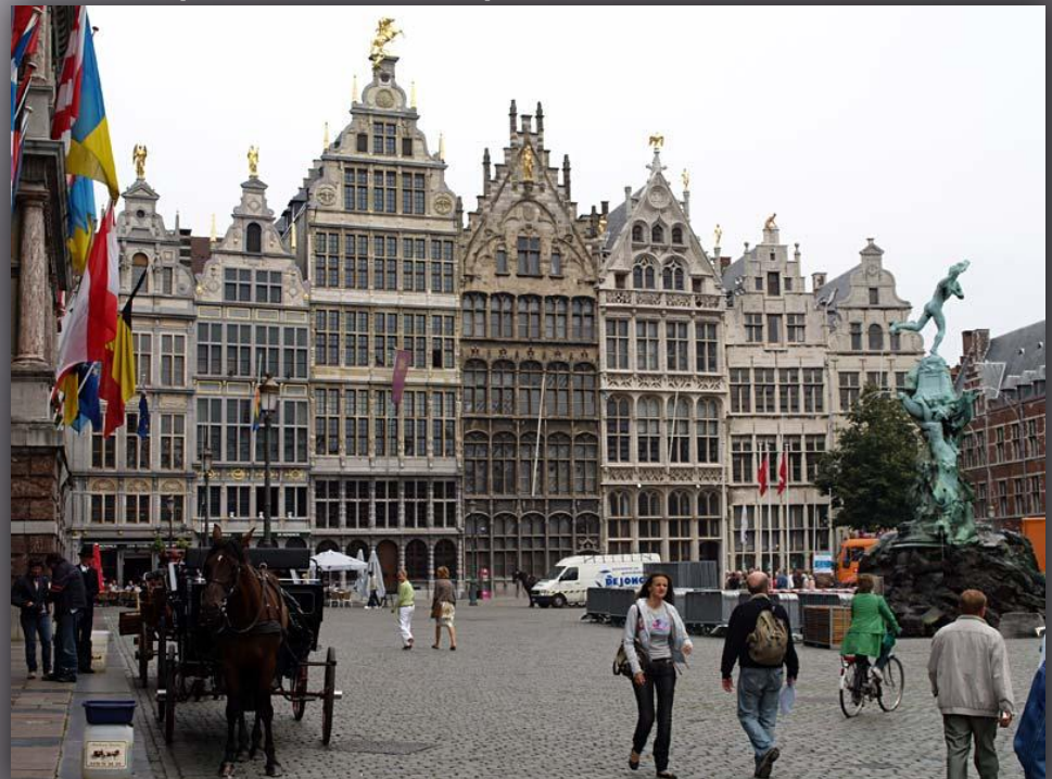
Рис.1 галерея мясного рынка в Антверпене

На рубеже XVII и XVIII вв. Рим перестал быть мировым центром строительного искусства. На смену ему выступили школы строительного искусства в других странах Европы, и прежде всего во Франции, а затем в России.