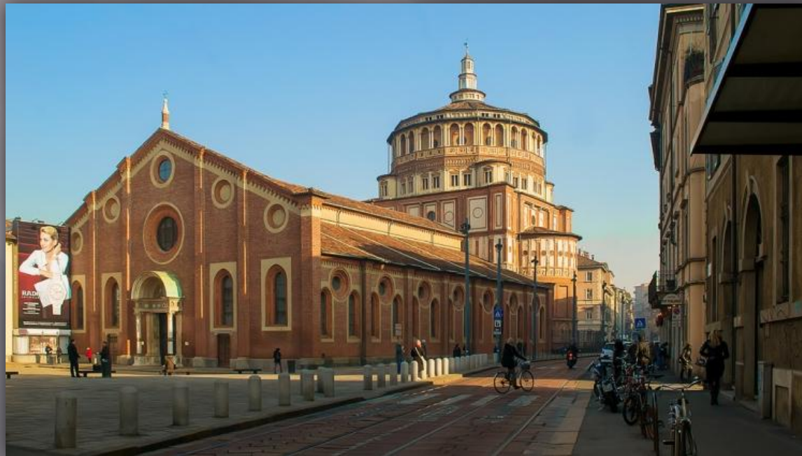
Рис.1 церковь Св. Марии делла Грациа

На ряду с Флоренцией интенсивное строительство, развернулось в XV в. в ряде других городов Италии. В числе первых итальянских городов, где новый стиль эпохи Возрождения стал быстро внедряться, был Милан, в котором начал строительную деятельность крупный зодчий эпохи Возрождения Браманте (1444-1514) , создавший несколько церквей, среди которых особо выделялась церковь Св. Марии делла Грациа (Рис.1).