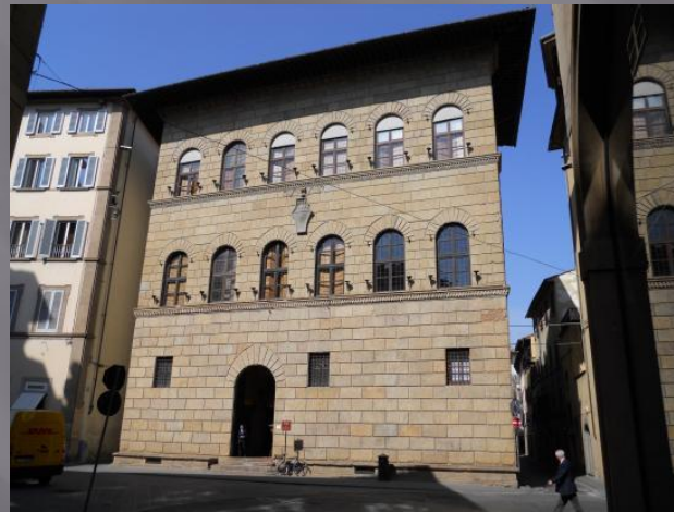
Рис.2 палаццо Антинори