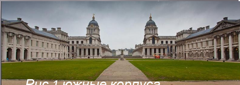
Рис.1 южные корпуса госпиталя в Гринвиче

Однако к концу XVII в. Кирпич, получивший во времена Рэна в строительстве большое применение, начал уступать