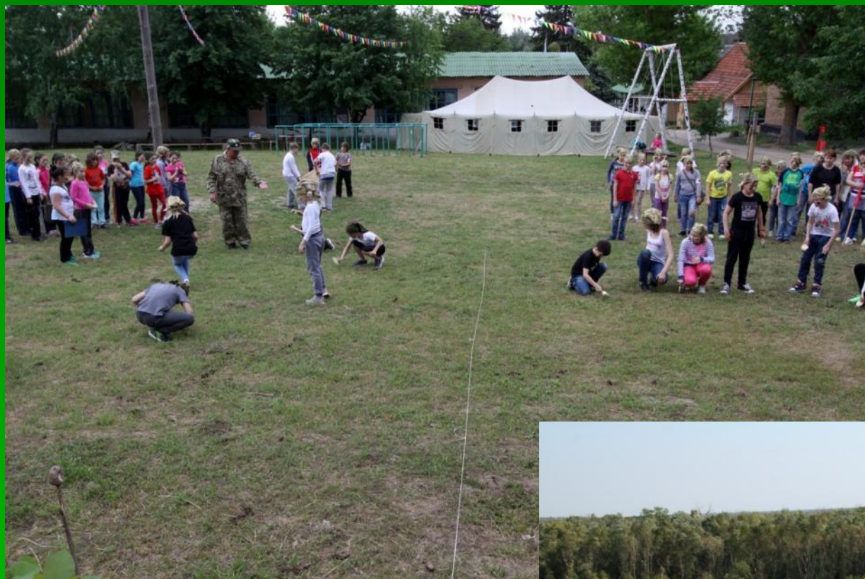
Конкурс саперы – «разминируем» местность