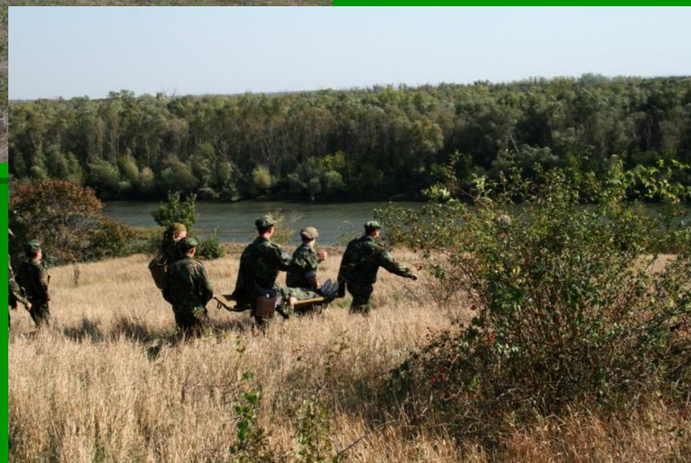
Конкурс первая медпомощь – переноска «раненого»