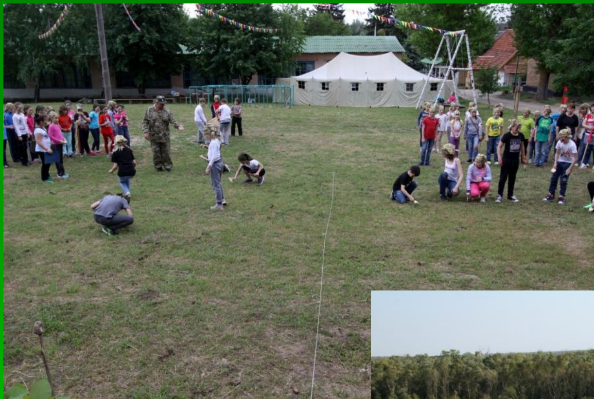
Конкурс саперы – «разминируем» местность